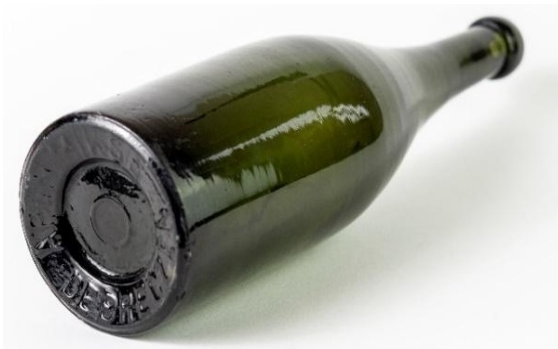
ÁRON MIKSA DEBRECZEN feliratú öntött sörösüveg, 19. század vége (Korompai Balázs magángyűjteménye)