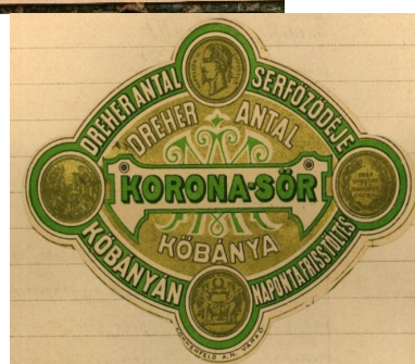
Az Áron Miksa cég 1895-ben bejegyzett, Dreher védjegyes sörcímkéi (HBVL 5)