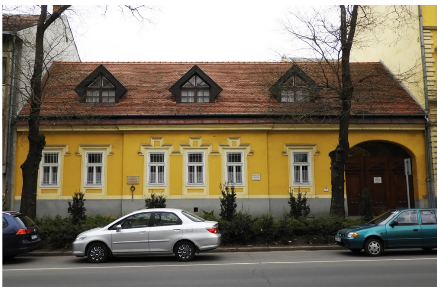
A Szent Anna 24. számú ház napjainkban