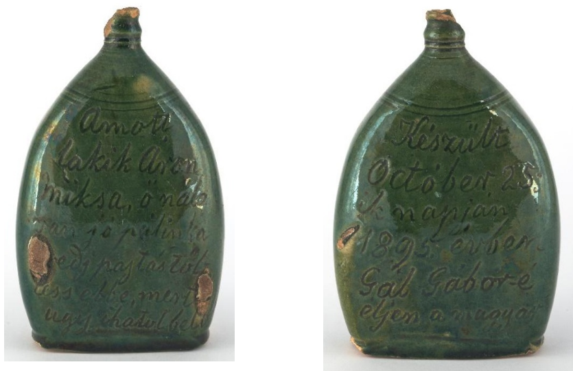
Cserép butella a Déri Múzeum gyűjteményéből (FAd.143493-2018, FAd.143494-2018)