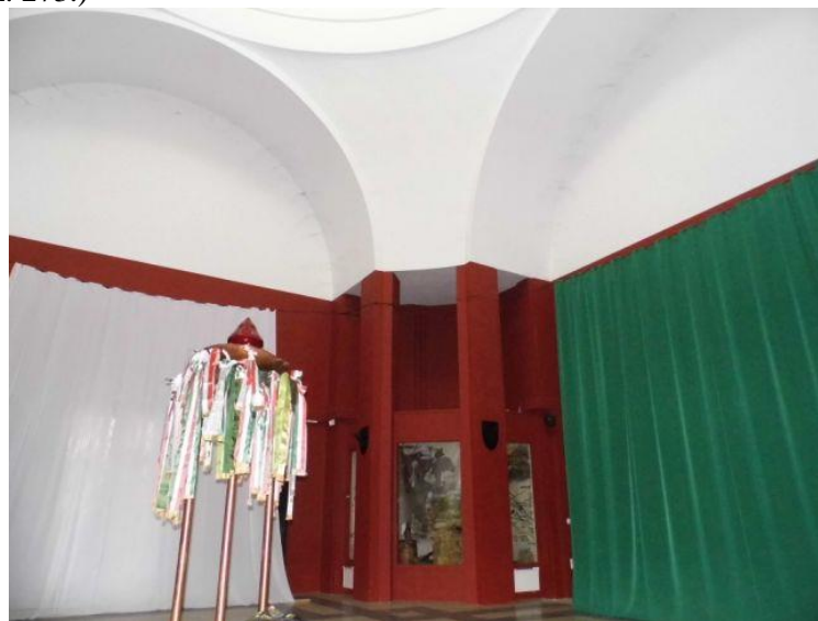
5. kép: A Hősök mauzóleumának belső tere. Fotó: Bodó Péter, 2022