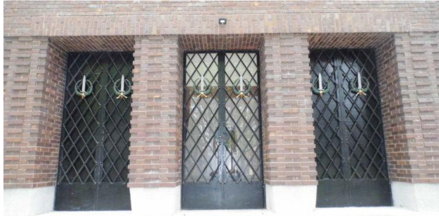
4. kép: A keleti bejárat.