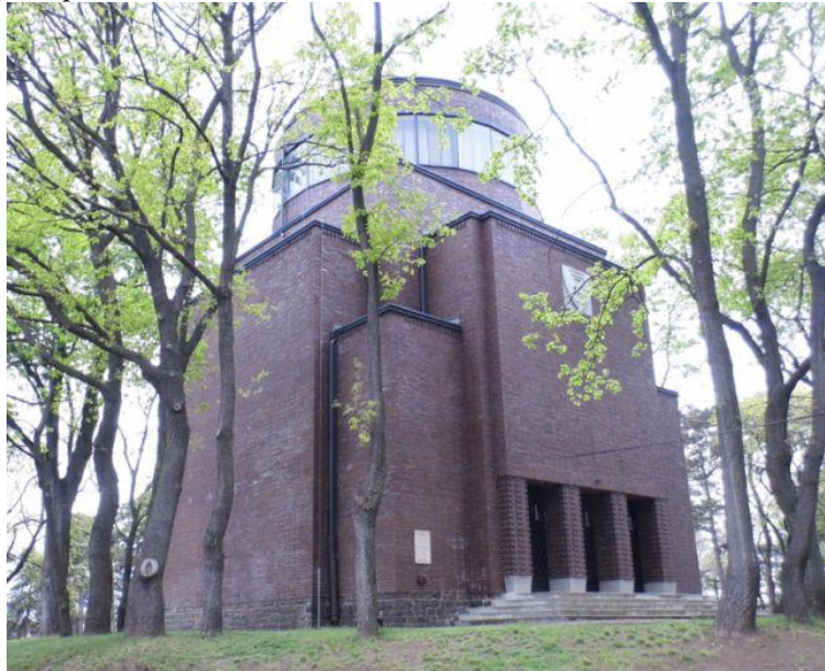
3. kép: A Hősök mauzóleumának délkeleti nézete.

hasábok egészítik ki. Az így körülépített tömb tetején egy 5 méter magas, 10 méter átmérőjű henger áll – kupola hatását keltve –, melyet enyhe lejtésű, bádoggal borított, úgynevezett gömbsüveg tető fed. Az épület teljes magassága 19,5 méter. (Tér és Forma, 1932. 9. sz. 274.) Ez a világos tagolás a modern elvekből következik, és az épület vasbeton szerkezete is ennek felel meg. A tiszta, mértani formák által sugallott örökérvényűség – mely az ókori építészethez is köti – kellően monumentális hatást kölcsönöz, ami elengedhetetlen egy emlékezőt szolgáló épületnél. (Magyar Építőművészet, 1983. 2. sz. 26.)