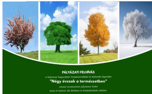
8. kép: A 2024-es pályázat felhívása