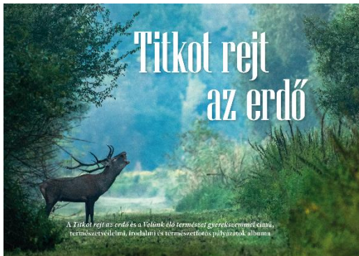
7. kép: A 2023-as kötet borítója

A jutalmazott pályaműveket december folyamán kötetbe rendezi az egyesület, és egy ünnepség keretein belül fogják bemutatni a könyvet (7. kép) és a díjazott képeket.