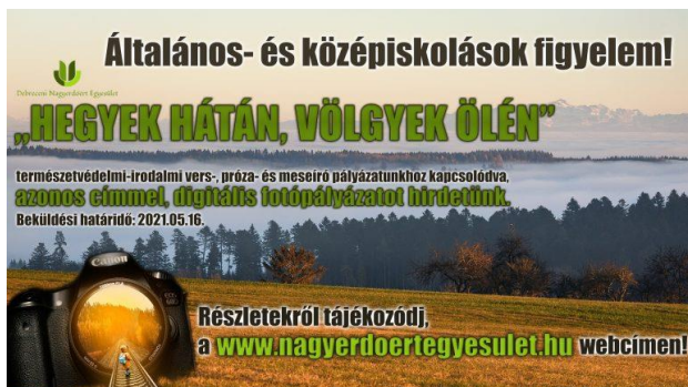
4. kép: A 2021-es pályázat felhívása

2021-ben is meghirdették (4. kép) a hazai és határon túli általános és közép-