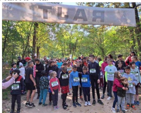
11. kép: A IX. Fuss, kocogj, sétálj felhívása és a gyerekek a rajtnál