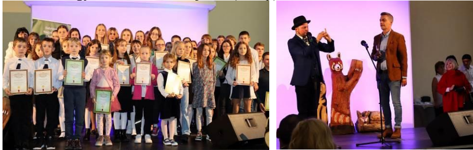
6. kép: A 2023-ban díjazott gyerekek és pillanatkép a díjátadó ünnepségről