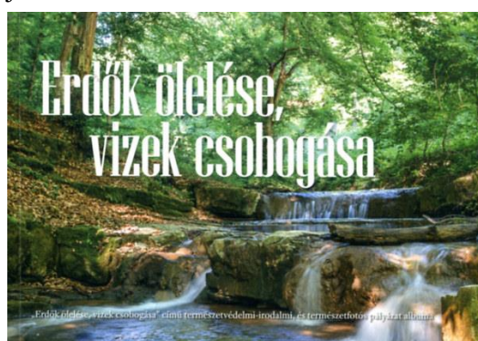
5. kép: A 2022-es kötet borítója

iskolások részére a természetvédelmi vers-, mese- és prózaíró pályázatot, amely ezúttal természetfotó kategóriával is kiegészült. A „ Hegyek hátán, völgyek ölén ” (4. kép) című pályázatra összesen 932 szöveg és több mint 700 fotó érkezett, melyeket ismert szakemberekből álló zsűri bíralt el, a zsűrielnök ekkor is Halász Judit