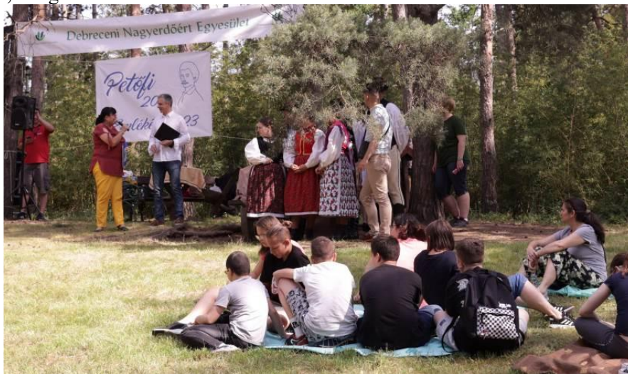
10. kép: Pillanatkép „ A virágnak megtiltani nem lehet ” irodalmi piknikről