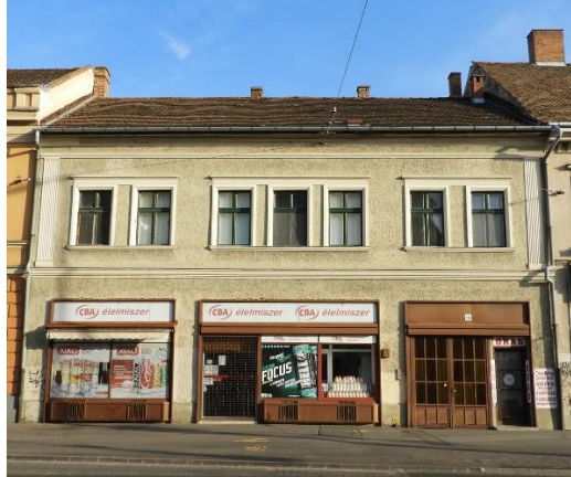
A Kossuth utca 15. számú ház napjainkban. Az egyemeletes ház földszintjén ma is egy üzlet működik, az emeleten pedig lakások vannak 5