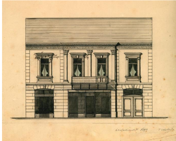
Rothschnek V. Emil Kossuth utca 15. számú házának átalakításához Tóth Béla által 1890-ben készített homlokzati tervrajz 38