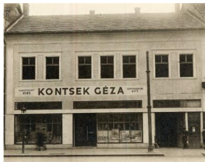
Az 1944. november 19-én készült felvételen a második világháború pusztítása során megsemmisült Kossuth utca 15. számú ház látható 88