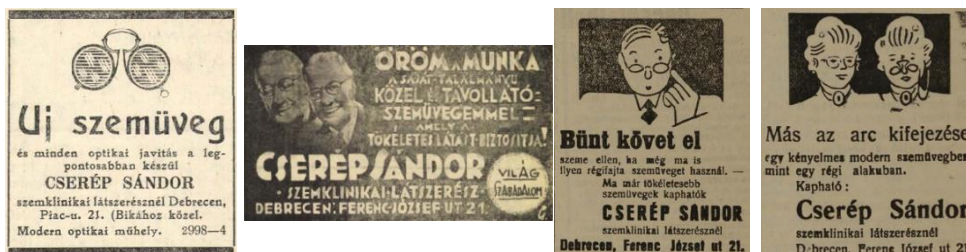
Hirdetések. Nyírvidék 1940. évi számaiban