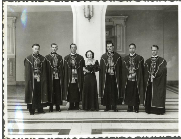
9. kép: Doktoravatás, 1940. május 4. (Szabó Magda a frissen avatott doktorok között)