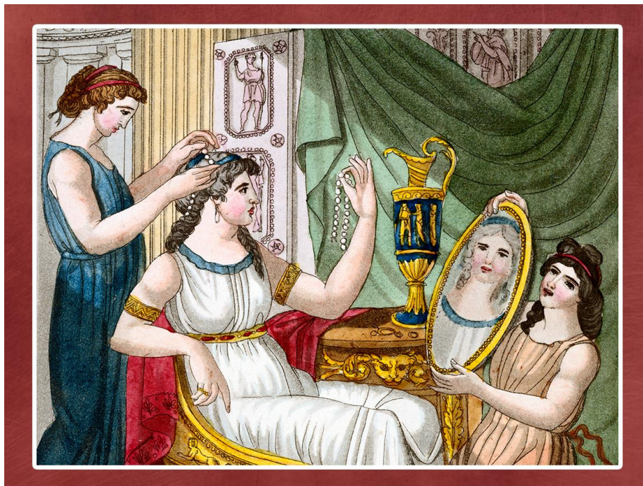
7. kép: Modern módszer vagy ősi szépségpraktika? forrás: Tóth (2020)

https://www.noklapja.hu/aktualis/2020/09/13/okori-szepsegepraktikak-otthoni-szepsegapolas/