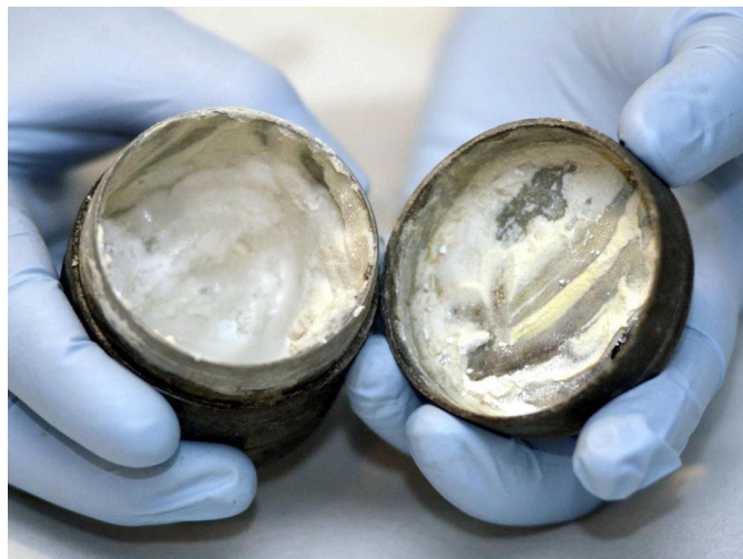
6. kép: Egy kb. Kr.u. 150-ből származó, 5 cm magas és 6 cm átmérőjű fém tégelyben talált krémet mutat be Liz Barham, a Museum of London konzervátora; forrás: Tóth (2020)

https://www.noklapja.hu/aktualis/2020/09/13/okori-szepsegpraktikak-otthoni-szepsegapolas/