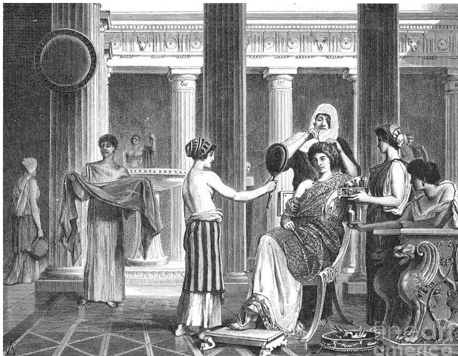
4. kép: Napi szépségápolás római módra; forrás: (sz.n.) (2014)

https://trendmano.blog.hu/2014/10/26/napi_szepsegapolas_romai_modra