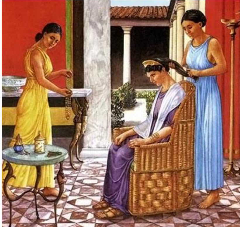
5.k ép: Pipere, wellness és fitness az antik nőknél; forrás: Vágási (2015) https://romaikor.hu/a_romaiak_mindennapi_elete/romai_nok/romai_szepsegapolas/szepi_tkezes/cikk/hajapolas_hajfestes

Bemutatja a női divatot, arc- és hajfestést, és az ehhez társuló férfi szépségápolást, elsősorban a színházakban. Harc indult a szép arc, a szép külső elérésére.