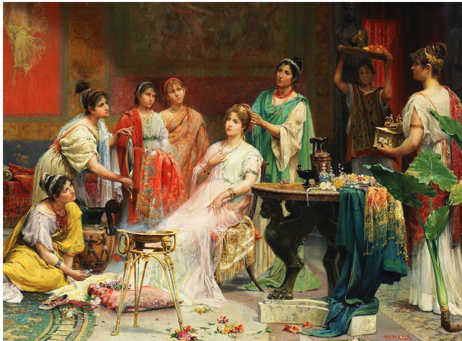
3. kép: Öltözködés és szépségápolás a császárkori Rómában; forrás: Hughes (2020) https://mult-kor.hu/ltzkdes-es-szepsegapolas-a-csaszkori-romaban-20200717

„S nekünk az a feladatunk, hogy megvizsgáljuk: hogy szépítette magát az ókor asszonya. Ott, ahol a kor lazult erkölcsse a férfiak szépségápolását is magával hozta, arra is ki fogunk terjeszkedni, hiszen ez is a rómaiak szépségápolásához tartozik.” 5