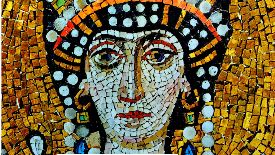
8. kép: Ilyen volt a szépségideál az ókori Rómában; forrás: Simon (2021) https://femina.hu/szepseg/okori-roma-szepsegapolas/

„Talán sikerült rámutatnunk arra a fontosságra, melyet a szépségápolás a római életben képviselt.” 14