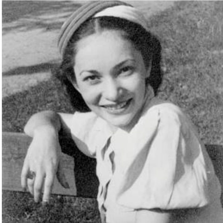
1.k ép: Szabó Magda debreceni egyetemistaként