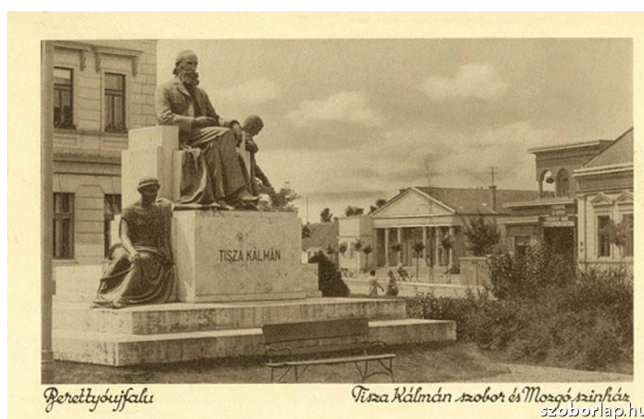
Tisza Kálmán egykori szobra Berettyóújfaluban (1928–1942)