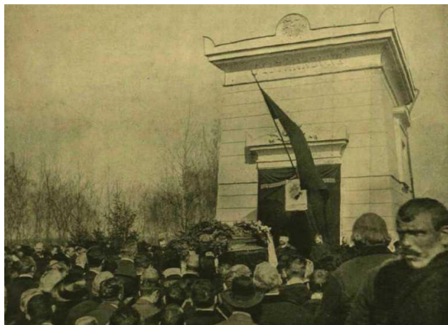
Tisza Kálmán temetése Geszten 1902. március 26-án. 72

2019-ben épült tanuszodát róla nevezték el, mert Nyírbaktán kötött házasságot. Csak Pápán van – 2020 óta – utca elnevezve róla. 70 Köztéri szobra ma már nincs. 71