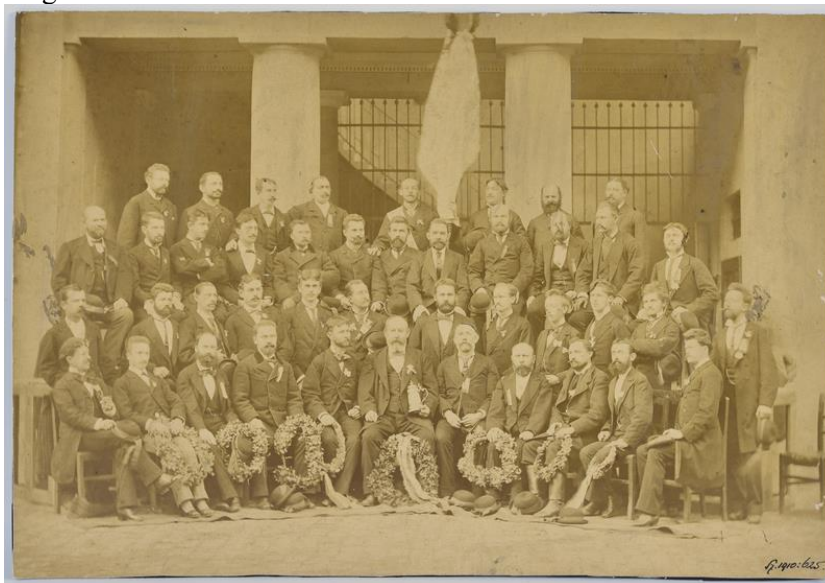
2. A Debreceni Dalegylet 1880-ban 32