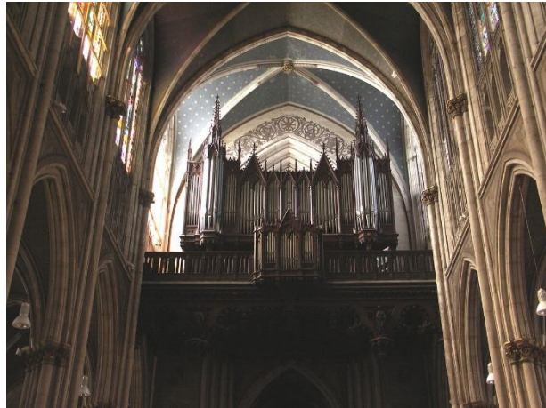
3. A Nancy-i St. Eglise bazilika orgonája

hangszeréért aranyérmét kapott. A Nancy-i plébánia a kiállítás után vásárolta meg.