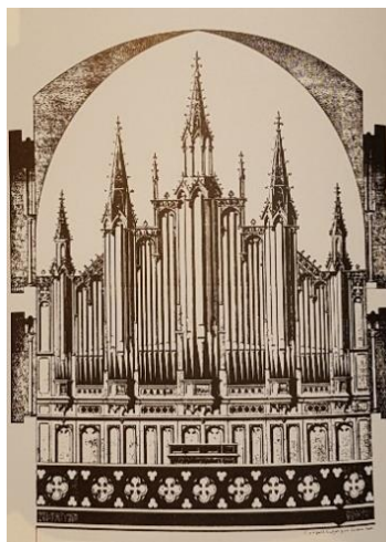
4. J. Merklin orgonája A Szt. Péter katedrálisban Genfben (1864–66)

A genfi Szt. Péter katedrális három manuális, 45 regiszteres orgonáját 1864–66-ban készítette a Merklin-Schütze cég.