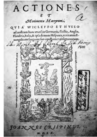
1. ábra: Joannes Crispinus, Actiones et Monimenta Martyrum , Genevae, Crispinus, 1560. Tiszáninnyi Református Egyházkerület Nagykönyvtára, Sárospatak