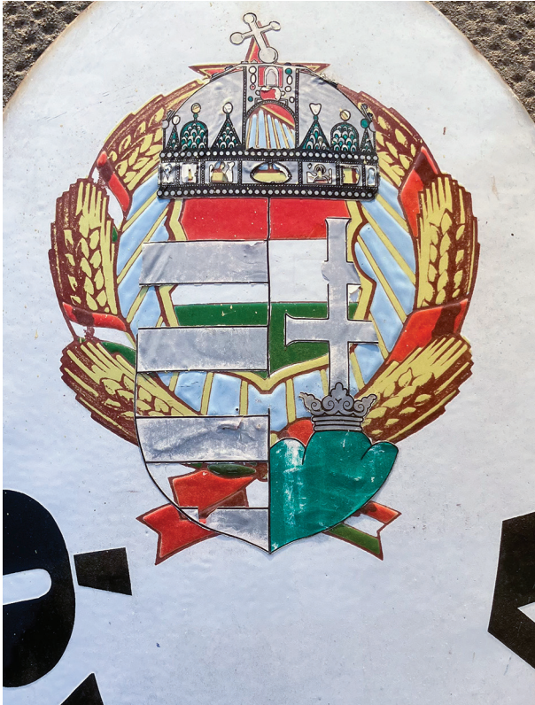
[2. kép] Címerváltás, Úttörő úti óvoda, Kaposvár, 2018.

egyértelmű, hogy nem a teljes eltüntetés volt a cél. Itt a Kádár-címer a saját képének hiányában maradt fent, rituális folytonosságot teremtve a megélt és a már történelemmé változtatott múlt között. A rendszerváltás hivatalos verzióját megjelenítő, 1990-es koronás címeres MDF választási plakáton az elszürkült Kádár-címer alól feltörő, azt mintegy lerobbantó, színekben pompázó régi/új koronás címert láthatjuk, míg a félprivát kivitelezésű duplacímeres verziókon éppen az ellenkezője történik. A két rendszert elválasztó átmeneti állapot ideológiai szuperpozícióját megjelenítő duplacímer egy olyan heraldikus lékként is felfogható, melyen keresztül láthatóvá válik, ahogyan a kettős beszéd átszivárog a puha diktatúrából a langyos demokráciába.