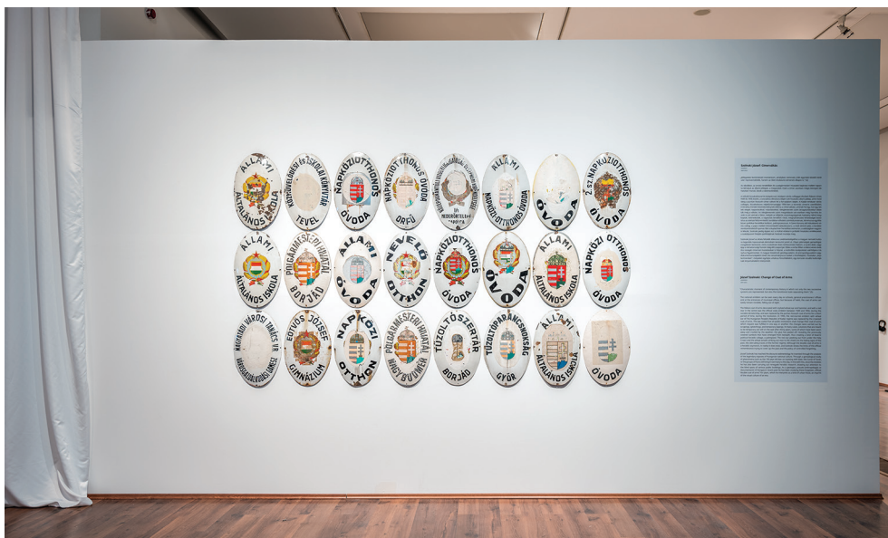
[3. kép] Szolnoki József: Címerváltás , 2007–2023, installáció, változó méret, Re:Re, Művészi újrajátzás, az újrajátzás művészete , MODEM, Debrecen.