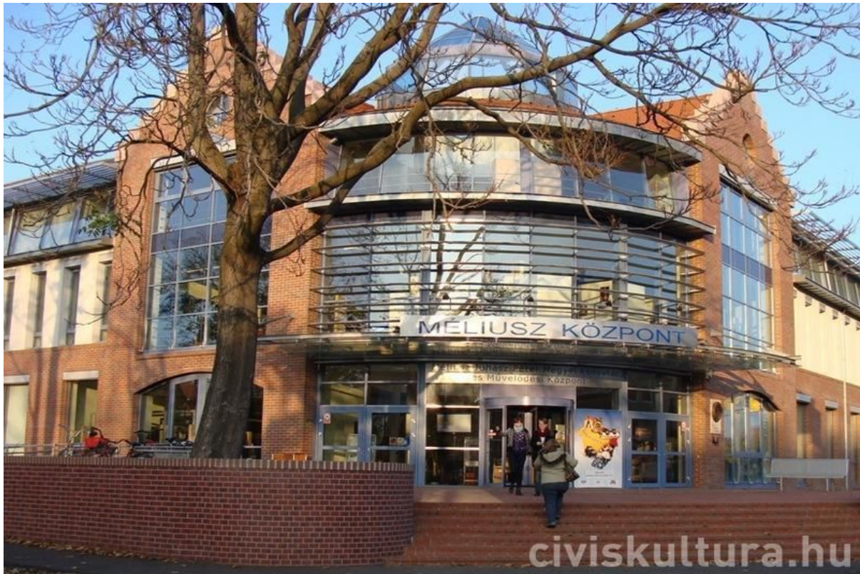
2. kép. A Bem téri épület