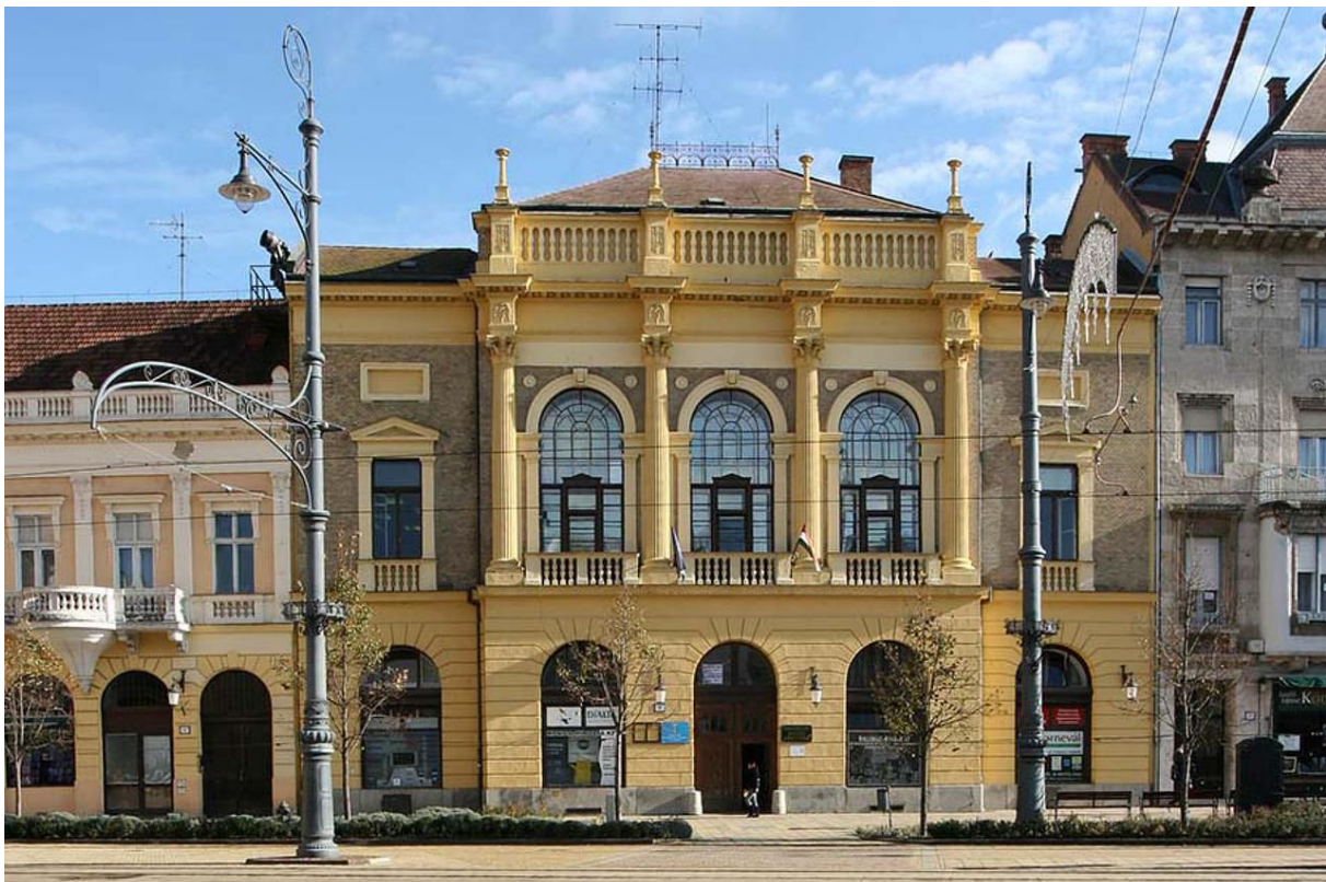
1. kép. Debrecen, Piac utca 8.

1951-ben államosították a Déri Múzeumot, melynek épületében tovább működött a könyvtár. 1950 nyarán a Népkönyvtárak Országos Központja, amely a közművelődési könyvtárak felügyeletét végezte, a népkönyvtárak könyvanyagának cseréjére Körzeti Könyvtárat alapított Debrecenben. Feladata községek és tanyaközpontok számára népkönyvtárak létesítése, valamint könyvtárosképző tanfolyam szervezése volt. „a megyei és járási könyvtárak létesítése során a körzeti könyvtárakat a megye, ill. járás székhelyén lévő városi könyvtárakkal egyesíteni kell. Ezek az új intézmények kettős feladatot kaptak: egyrészt a megyeszékhely lakosságának [...] ellátását, másrészt a [...] városi közkönyvtárak felügyeletét, és mindezek módszertani támogatását.” 1