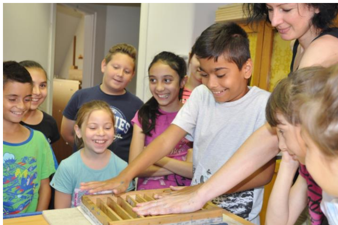
5. kép: Papírméretes a Jász-Nagykun-Szolnok Megyei Levéltárban

A TÁMOP foglalkozások mellett és azokon túl is rendszeresen tartunk rendhagyó történelemórákat. Különösen népszerűek papír- és írástörténeti foglalkozásaink , melyek az egykori Szolnoki Papírgyártól átvett állandó kiállításra épülnek és az óvodásoktól kezdve a nyugdíjasokig minden korosztály számára élményszerűen mutatják be az íráshordozók fejlődését és a papírméretes titkát. 10 (5. kép)