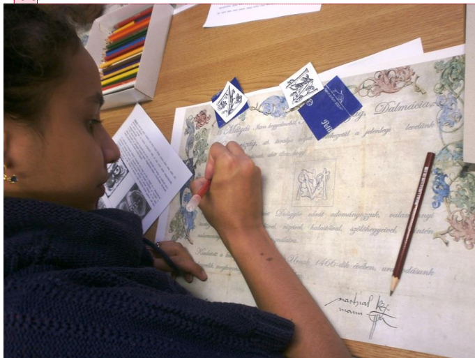
4. kép: Levéltár-pedagógiai foglalkozás a Jász-Nagykun-Szolnok Megyei Levéltárban

Nagyobb csoportot jelent az iskolások tömege, akiket más közgyűjteményekhez hasonlóan mi is igyekeztünk bevonni közművelődési tevékenységünkbe, mivel az iskolák révén szervezetten megszólíthatók. A mi levéltárunk volt az első, amely sikeresen pályázott uniós TÁMOP projektre, iskolán kívüli oktatási tevékenység segítésére. Ennek keretében 6 év alatt összesen 2161 hátrányos és halmozottan hátrányos helyzetű diák vett részt levéltár-pedagógiai foglalkozásainkon. 9 (4. kép) A program hat éve gyakorlatilag egybe esett a gazdasági válság utáni időszakokkal. A költségvetési megszorításokra adott, országos visszhangot kiváltó kezdeményezéseink közül talán ez járt a legnagyobb szakmai elismeréssel és jelentősen növelte a média és a lakosság érdeklődését is intézményünk felé.