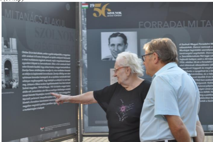
3. kép: 56-os emlékvé alkalmából rendezett kiállítás Szolnok közterein

Rendszeresen készítünk időszaki kiállításokat is. Ezek közül kiemelném az 56-os évforduló alkalmából a város felkérésére létrehozott köztéri kiállításunkat, melyet a város négy forgalmas terén mutatunk be óriás táblákra nyomtatva, így több ezren láthatták azokat. 5 A megvalósítást a város pályázati forrásból finanszírozta, ugyanakkor az együttműködés mutatja, hogy hiába van a városnak múzeuma és egyéb kulturális intézményei, a 20. század történelmének feltárásához, a helyi események bemutatásához elengedhetetlen a levéltárosok munkája és ezt elvárják akkor is, ha nem ők a fenntartóink. (3. kép)