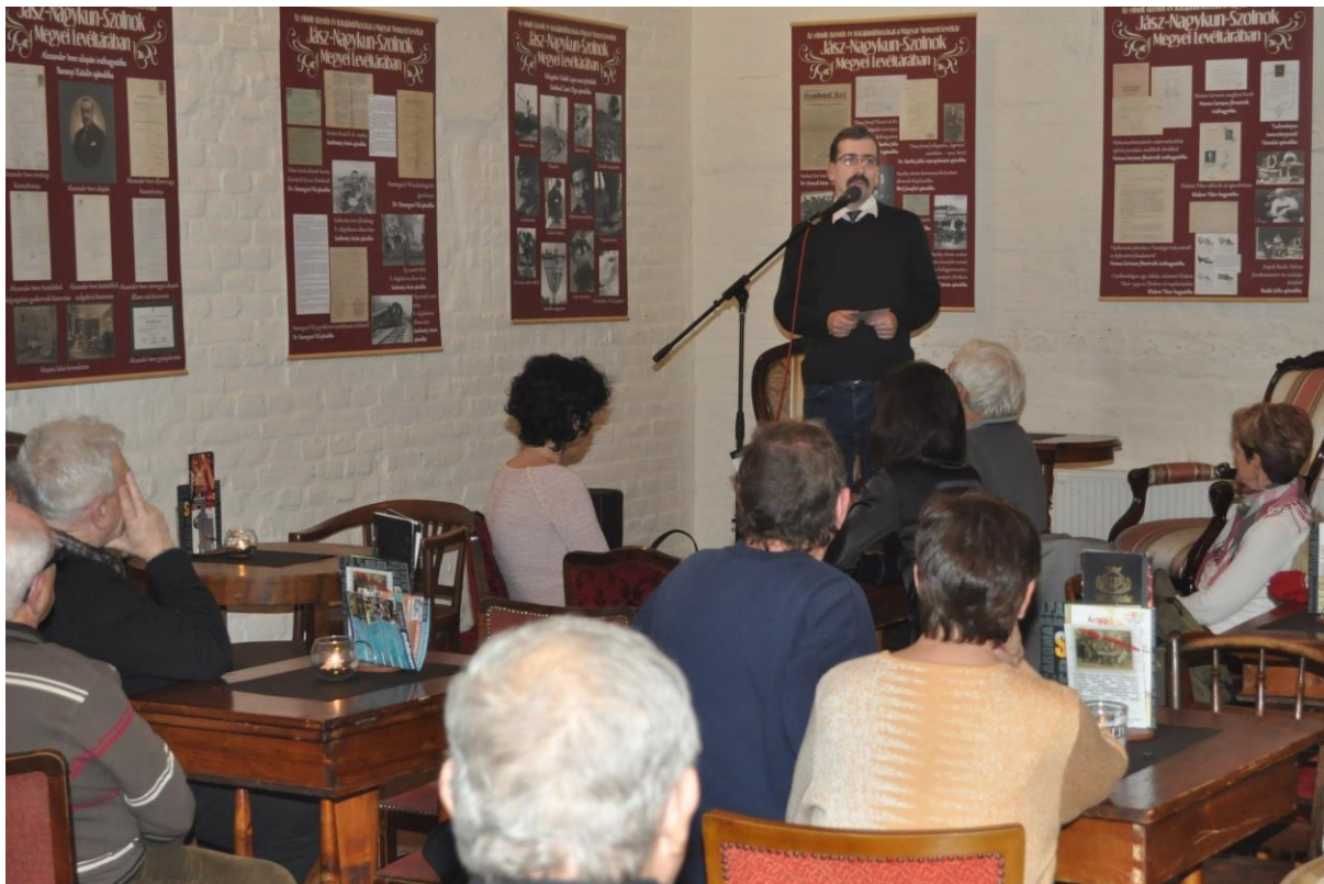
7. kép: „Bővülő történelem” kiállítás megnyitója a szolnoki TiszapArt Moziban 2018. január 9-én.

tehát, hogy kimozduljunk a megyeszékhelyről. Jászberényt követően Tiszaföldváron a Tiszazugi Földrajzi Múzeummal rendeztünk közös kiállítást ebből az anyagból, melyet egybekötöttünk magánirat digitalizálással is. Azzal a felhívással fordultunk a helyiekhez, hogy a megnyitóra mindenki hozzon magával egy, vagy több iratot, amit lemásolhatunk, melynek sokan eleget is tettek. Legutóbb Túrkevére jutott el tárlatunk és tervezzük további helyszínek sorra vételét is.