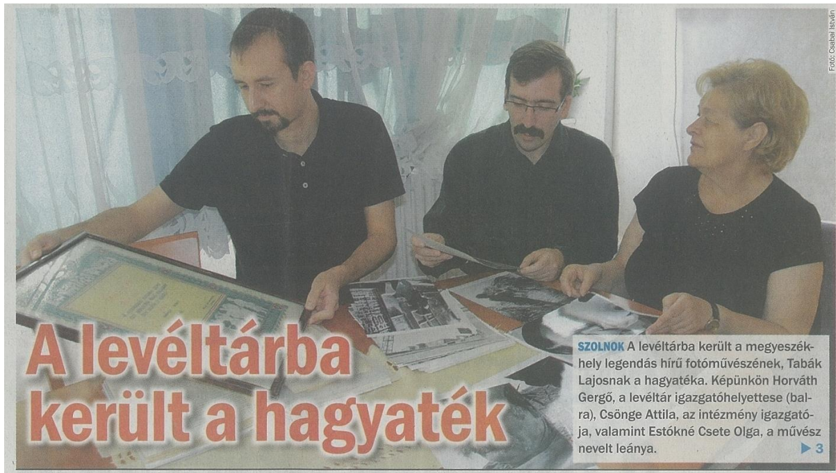
3. kép: Új Néplap, 2016. szeptember 27-i számának címlapképe

unalmában az újságot olvasva talált iratajándékozásról hírt adó cikke és így határozta el, hogy ő is nekünk ajándékozza régi, történeti értékű iratait. De a Szolnok Televízió segítségével is készíthettünk olyan magazinműsort Levéltári Kincseink címmel, amiben olykor ajándékba kapott dokumentumokat is be tudunk mutatni. Ezeket azóta is ismétli a televízió és így rengeteg emberhez elér felhívásunk az iratajándékozásról. (3. kép)