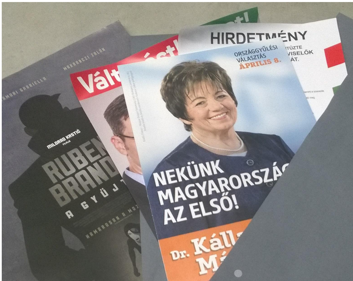
5. kép: Pártok, egyesületek, filmek és rendezvények plakátjai a Levéltárban

A szemléletformálásra példa lehet a Szolnoki Járási Hivatal esete, mely tavaly kapott új épületet. Tőlünk kérték segítséget, hogy a folyosókat a járás történetét bemutató levéltári dokumentumokkal díszíthessék. Ennek jegyében kétszer is felvilágosító előadást hallgathattak meg az ott dolgozók a háborús iratpusztulásokról és a dokumentumok megőrzésének fontosságáról, aminek eredményeként idén már maguktól ajánlották fel, hogy az osztályvezetőkről készült tabló másolatát szeretnék elhelyezni a levéltárban az utókornak történő megőrzés céljából.