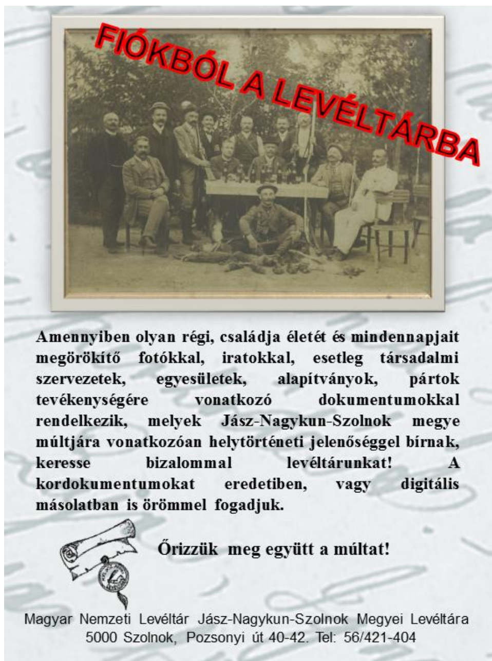
8. kép: Magánirat ajándékozást népszerűsítő szórólap

Összefoglalva az elhangzottakat elmondható, hogy a magánirat ajándékozás rendkívül értékes adalékokkal gazdagíthatja a történettudomány által vizsgált források körét. Az ajándékozás fellendítése ugyanakkor nem megy egyik pillanatról a másikra. Sok év, esetünkben három évtized munkája kellett hozzá, hogy ismertségünk és elismertségünk révén olyan pozitív kép alakuljon ki rólunk a köztudatban, hogy érdemben elő tudjuk mozdítani az iratajándékozást. Ebben nagy segítségünkre vannak a kiállítások, illetve a technika fejlődése révén a digitális másolatkészítés is. Bár még mindig a legjobb ajánlólevél a személyes ismeretség és bizalom, de már kezdik éreztetni hatásukat a helyi médiában közzétett felhívások, megszólalások is. (8. kép)