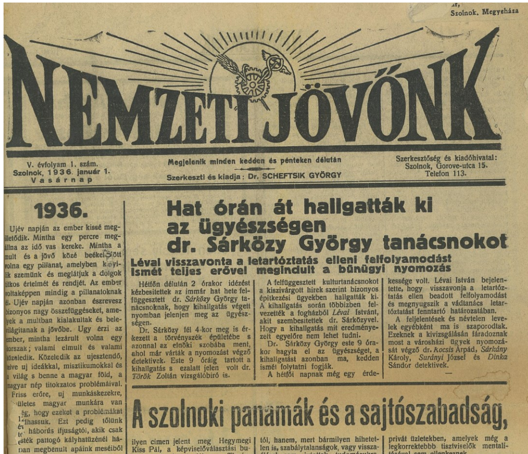
1. kép: A Nemzeti Jövőnk 1936. január 1-i számának címlapja

elmarasztalásokkal végződtek. Ezen ügy érintettjei közül senkit nem ítélték letöltendő börtönbüntetésre! 20