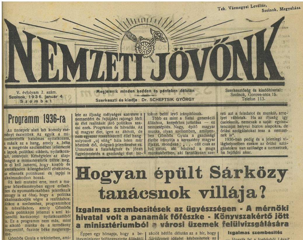
2. kép: A Nemzeti Jövők 1936. január 4-i számának címlapja

Eltelt tíz év, Szolnokra bevonultak a szovjet csapatok, a városházán új, kommunista városvezetés vette át az irányítást, és ha fellapozzuk a Szolnok városi közgyűlés 1945. január 25-i alakuló ülésének jegyzőkönyvét, akkor ott az alábbiakat olvashatjuk: