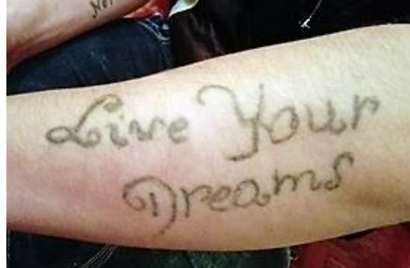
Motivációs, önazonosságot tükröző tetoválások