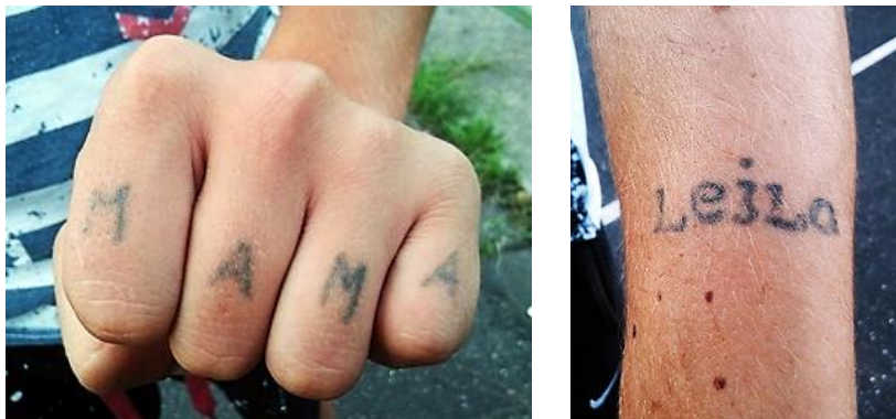
Családhoz kötődő tetoválások