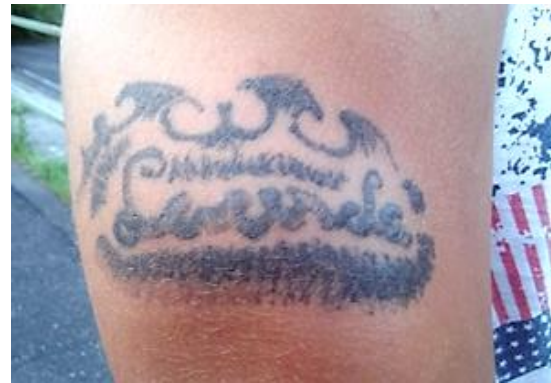
Egységet kifejező tetoválások