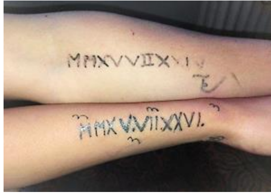
Szerelmi élethez kötődő tetoválások