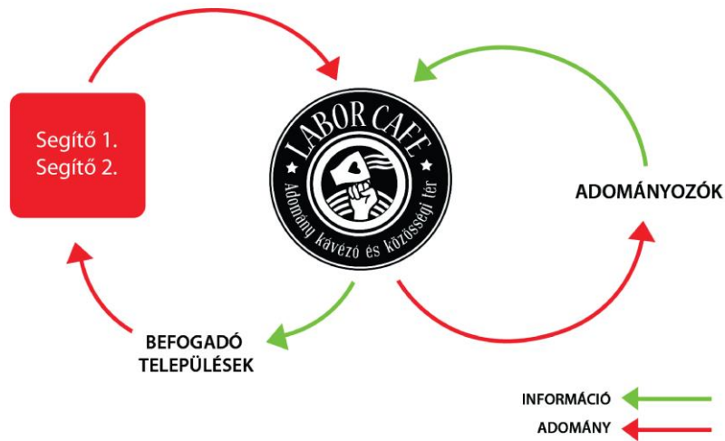
3. Ábra: A segítők közötti információk áramlása a Labor Café ukrán menekülteket segítő tevékenysége során a háború első 10 napjában

A tíz nap alatt kialakult rutin szerint „B” naponta több alkalommal jelezte a Szervezők és „D” felé a települések igényeit. „B” a beérkezett adományokból összeszedte azokat, melyek a kapott igénylistán szerepeltek. Amennyiben ezek közül valamelyiket nem találta az adományok között, Szervezők mozgósították kapcsolatrendszerüket a hiányzó cikk adományokból történő beszerzésére, vagy a beérkezett pénzádományokból megvásárolták azt. Az összeállított adománycsomagok elszállításáról „D” értesítette a települések képviselőit, melyek autót küldtek az egyes csomagokért. Némely esetekben a szállítást a Labor Café közösségén belül, a Bevont önkéntesek csoportjával, vagy a Másodlagos elérések csoportjából származó személyekkel oldották meg Szervezők.