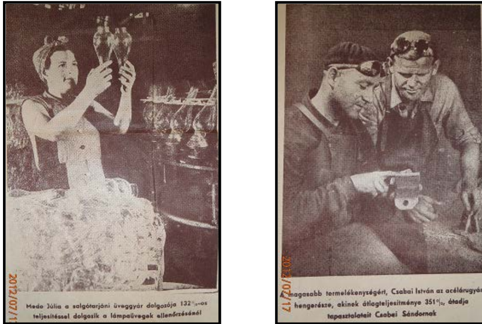
5. ábra. A munkaverseny megjelenése a propagandában