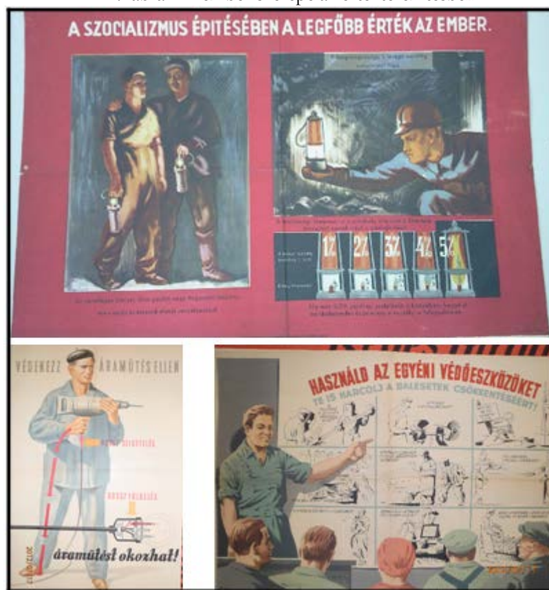
4. ábra. Az ember szerepe az értékteremtésben