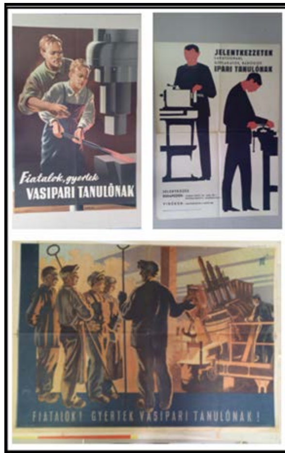
1. ábra. Korabeli toborzási propaganda