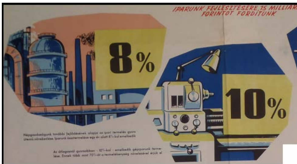
3. ábra. Mérsékeltabb áramlatok a teljesítményképzelésekben