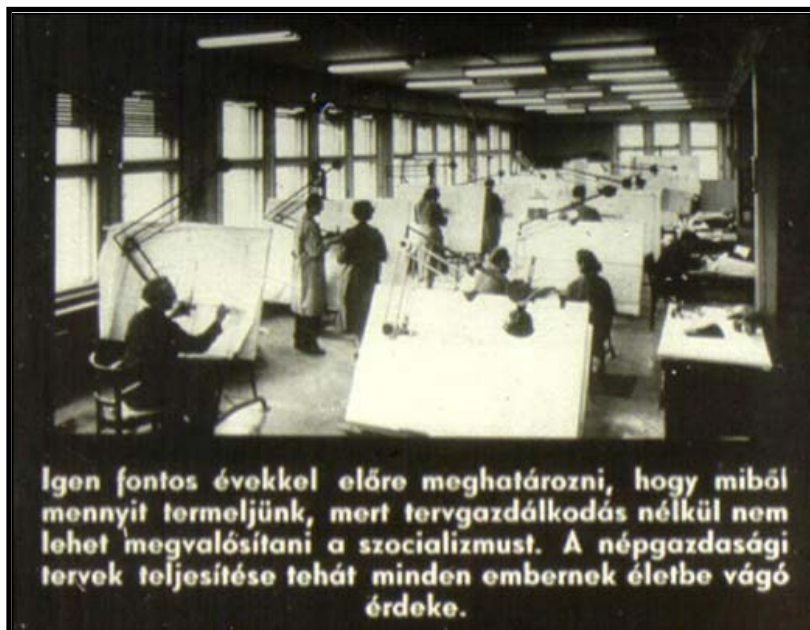
2. ábra. A tervgazdálkodás propagandája