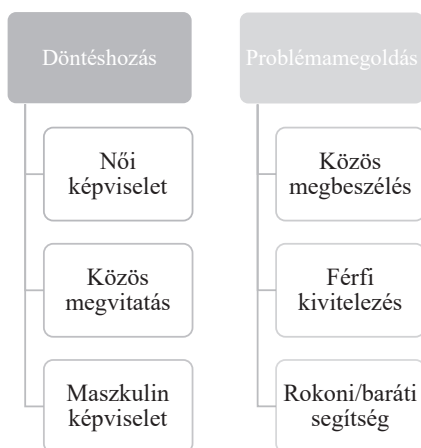
2. ábra. A döntéshozás és a problémák megoldásának csoportosítása

„A mama, testvérem, de nagyon nagy a család. Bármikor tudnék sok mindenkinek szólni. Van kinek szólni.” (Otthon maradó, foglalkoztatott 34 éves nő)