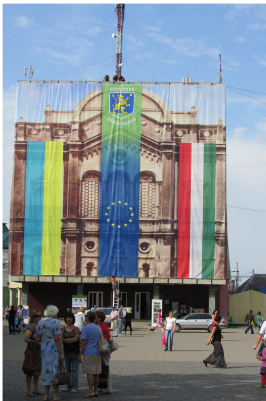
2. ábra. Az EU jelképe Beregszász központi terén