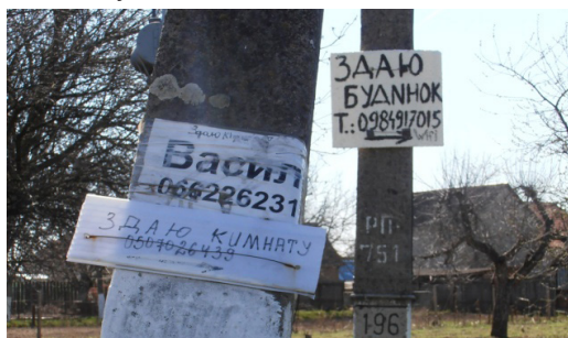
7. ábra. Ukrán nyelven szállást kínáló kiírások DEDA községben