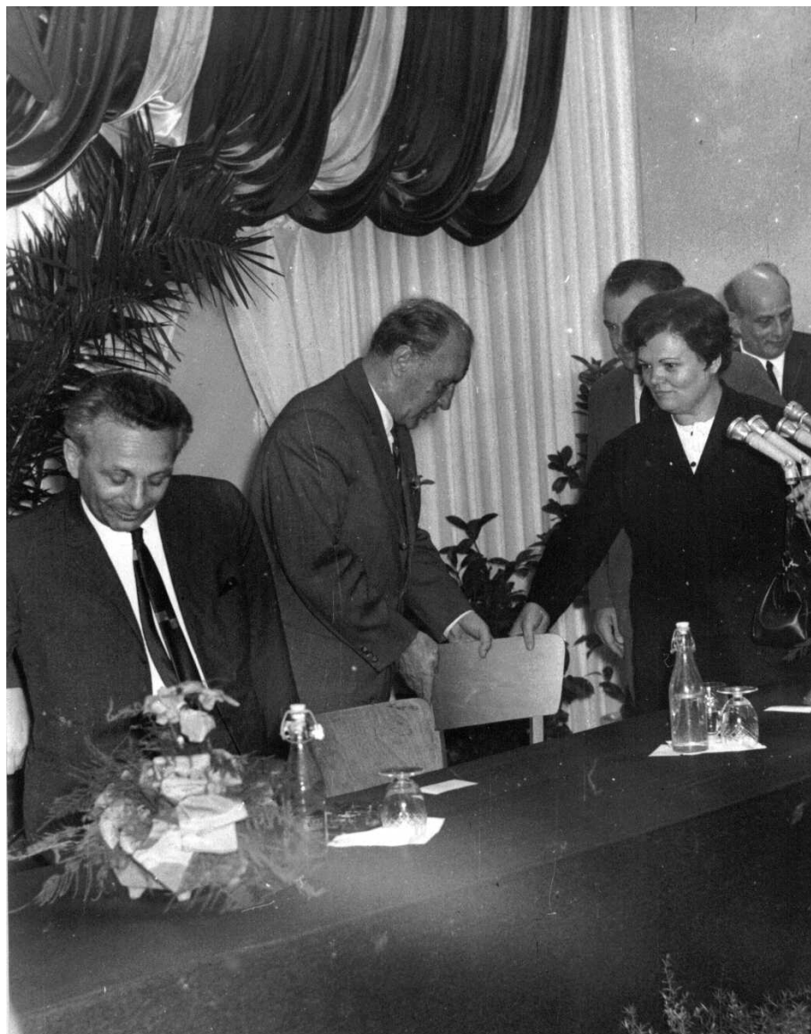
8. számú kép