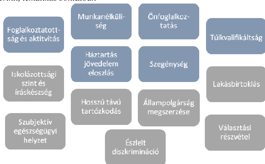
2. ábra: A Zaragoza indikátorok az Indicators of Immigrant Integration (2015) szerinti, tematikus bontásban

A kutatómunka ezen pontján a tanulmány elsődleges kérdésére („Hogyan mérhető a társadalmi integráció?”) az indikátorok fellelésével lényegében választ nyertünk, és az eszközt, amivel a társadalmi integráció elviekben mérhető, megtaláltuk. Ami azonban a mutatók részletes tanulmányozásával feltűnt, az magával hozott egy a bevezetésben tárgyalt fő kérdőjel helyére illeszkedő másik kérdőjelet, és egy egészen új irányt adott a kutatómunkának.