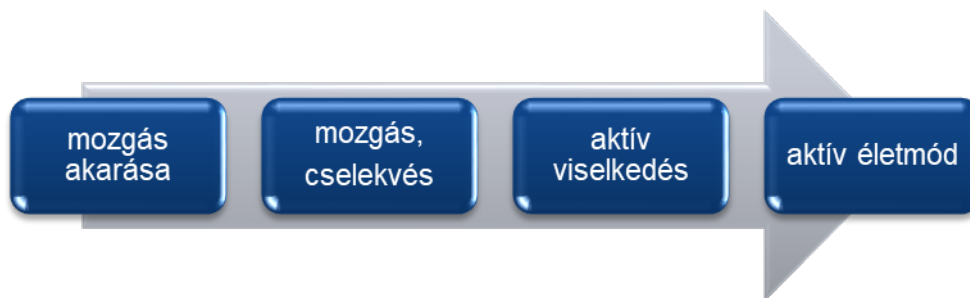
11. ábra: A konduktív nevelés céljai a hatásszervezés szempontjából

Következő lépésként feladat az aktív tanulási folyamat fenntartása, mely tanulási eredménye a mozgás, cselekedet újraszerveződése. Ehhez olyan komplex fejlesztés szükséges, melyben a holisztikus emberképből adódóan mind a mozgás, a beszéd, a kognitív funkciók, az érzelem, mind a szociális kapcsolatok egyidejű, egy személy általi fejlesztése valósul meg. Ahhoz, hogy a megtanult mozgás, cselekedet ne egy megtanult, de céltalan mozgás legyen, a mozgásszerűtnek azt az élet minden helyzetében meg kell tanulnia alkalmaznia. A megfelelő biológiai szükségletek és társadalmi elvárások biztosítása ehhez elengedhetetlen feladatnak bizonyul. Ilyen élethelyzetek lehetnek a játék, a tanulás, az óvodai élet, az iskolai élet, a munkavégzés, az önellátási tevékenységek vagy akár a szabadidő hasznos eltöltése. Ezek az élethelyzetek mindamelllett, hogy az aktív viselkedés létrejöttét támogatják, hatással vannak az ismeretek, jártasságok, készségek és képességek kialakulására is.