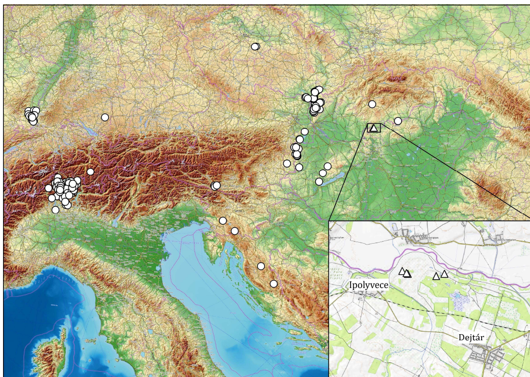
1. ábra A Carex fritschii Waisb. elterjedése [1]. Δ jelöli az új, Ipoly-völgyi előfordulásokat. Fig. 1 Distribution of Carex fritschii Waisb. [1]. Δ indicates the new occurrences in the Ipoly Valley

Évtizedekkel korábban felfedezett előfordulásai ismertek Dél-Szlovákiából, ahol megtalálták Zólyom közelében (ipoly-völgyi előfordulásaitól északi irányban mintegy 60 km-re, Kovácsfalvától nyugatra egy ponton (1988. augusztus, gyűjtő: MICHALKO, J.), illetve Ajnácskótól keletre (az Ipoly-völgytől északkeleti irányban mintegy 65 km-re, a Cserovai-dombvidéken, a Ragác-hegy lejtőjén és csúcsa közelében egy-egy ponton, 1963 és 1981 májusában, gyűjtő: SKALICKY, V.) [1]. Úgy tűnik, jelenleg az ajnácskői a legkeletibb ismert előfordulása (1. ábra).