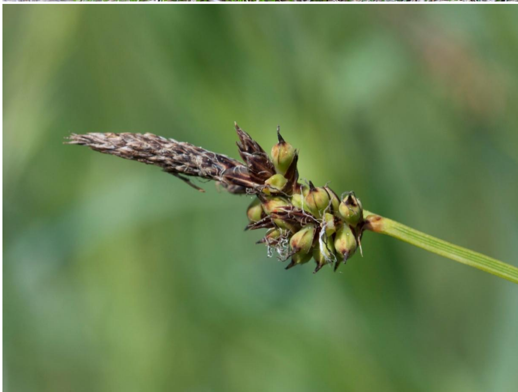
e4 ábra Carex fritschii Patak mellett fig. e4 Carex fritschii near Patak, Nógrád county