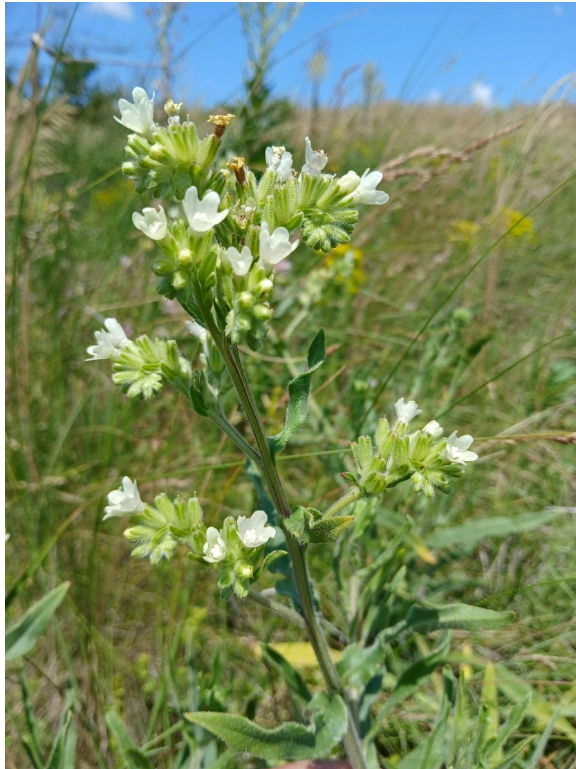
e1. ábra Anchusa ochroleuca Rád mellett

Fig. e1 Anchusa ochroleuca near Rád, Pest county