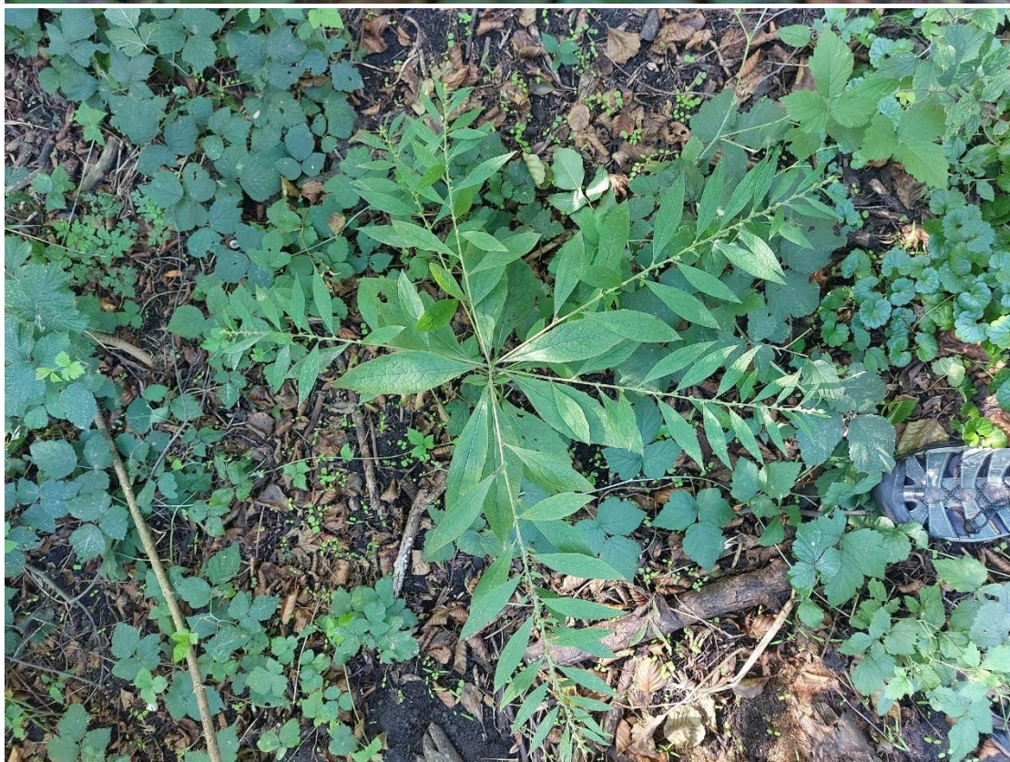
e2. ábra Carpesium abrotanoides Ócsa mellett Fig. e2 Carpesium abrotanoides near Ócsa, Pest county