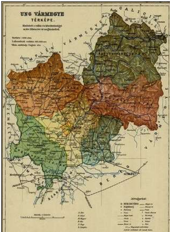
1.térkép Ung vármegye közigazgatási térképe (Hungaricana térképek. https://maps.hungaricana.hu/hu/HTTTerkepar/1652/ letöltve: 2020.02.12.)