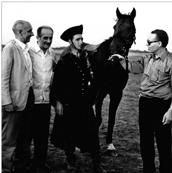
3. kép. Egyik kísérő rendezvény a Hortobágyi puszta meglátogatása volt. Adler professzor (balról a második) vendégeivel (Hardwick és Held professzorokkal)

káriesz kutatásról és harmadikként Bibby professzor, az amerikai Rochesteri Eastman-Alapítvány Fogászati Kutatóintézetének vezetője beszélt a fogzománc szervesanyaga és a caries kapcsolatáról. 8