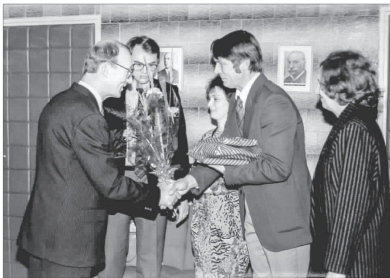
9. kép. Tanszékfoglalója után 1986 telén

intézményében, azonban így is meg lehet találni azokat a témákat, metodikákat, amelyek révén tudományos eredmények születhetnek. Nem véletlen, hogy 1994–2001 között az oktatók közül kilencen szereztek minősítést. 12 Keszthelyi professzor négyszer nősült meg, egy fia született.