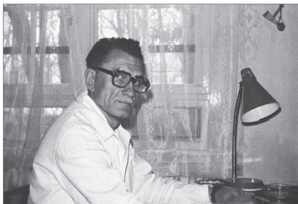
3. kép. Debreceni klinikaigazgatóként