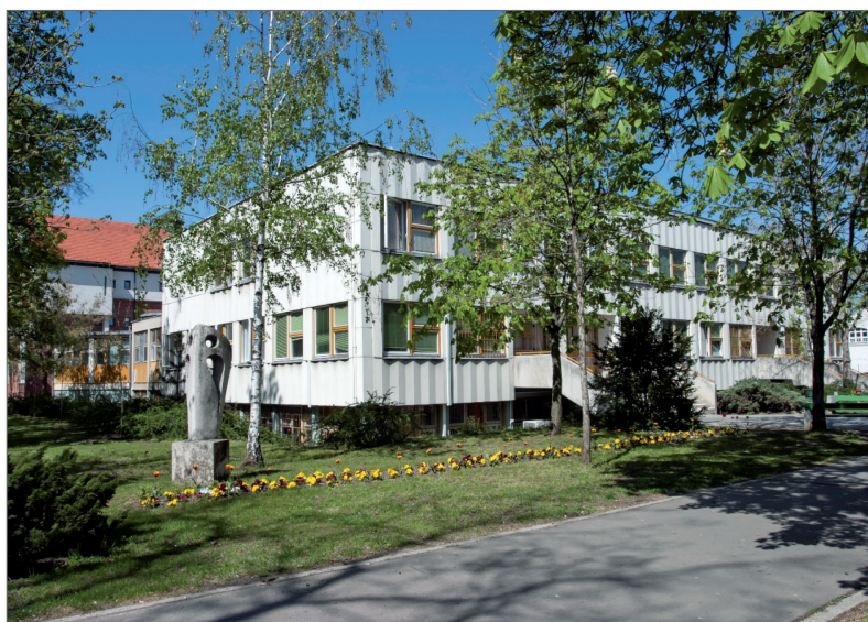
6. kép. A Stomatológiai Klinika új épülete.