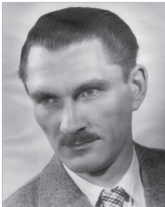
2. kép. Fiatal oktatóként Marosvásárhelyen

kis létszámú oktatógárda kellő szakmai fejlődésének biztosítását. Délutánonként gnatológiai kurzust tartott az érdeklődő kollégáknak. Szegedről oktatókat is hozott magával, akik sajnos pár év múlva sorra elhagyták a klinikát.