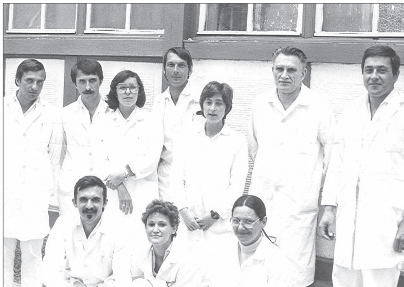
5. kép. Szentpétery professzor munkatársai körében

Az új épület még javában épült, tehát meg kellett szervezni a klinikai gyakorlatokat. Mivel a Szemészeti Klinikán működő Stomatológián csak öt konzerválószték volt, azok pedig a betegellátást szolgálták, ezért ideiglenesen a Tüdőgyógyászati Klinikán alakítottak ki egy pavilont (két helyiséggel) a betegeken végzett oktatás céljából. A III. évesek számára viszont már működött a Bem téren az Orvosi Vegytani Intézet alagsorában az ún. fantomterem, ahol kihúzott, illetve műanyag fogakon történt a gyakorlás. Közben a fogászati képzés curriculumát is át kellett dolgozni, egységesíteni az országos rendszerrel és a debreceni egyetemen akkor zajló integrált oktatási struktúrával is harmonizálni. Gond volt a kevés oktató (kezdetben 7 fő), melyek számát növelte, hogy a professzor hozott magával Szegedről oktatókat, illetve a későbbiekben az itt végzett fogorvosokkal töltötte fel a klinikát. Így is komoly gondot jelentett, amikor a 80-as évek közepén több középkorú, tapasztalt kolléga elment a klinikáról. (Egyik fő ok volt, hogy az egyetemek közül csak nálunk nem volt engedélyezett a magánrendelés folytatása.)