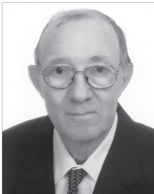
11. kép. Professor emeritusként