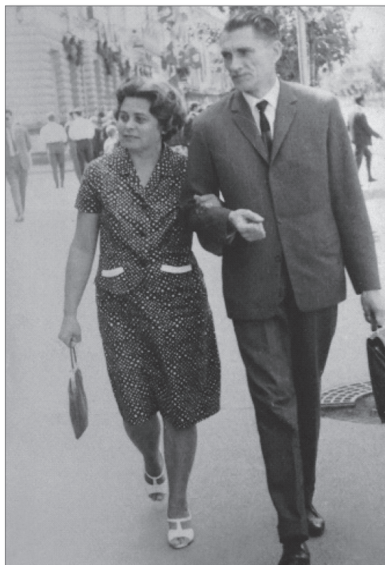
1. kép. Feleségével Marosvásárhelyen

dosításokat vezetett be (sorra vizsgálta az egyes szervek, majd a fogból beidegzésének finomabb részleteit). Eredményeiről közleményekben és előadásokon számolt be.