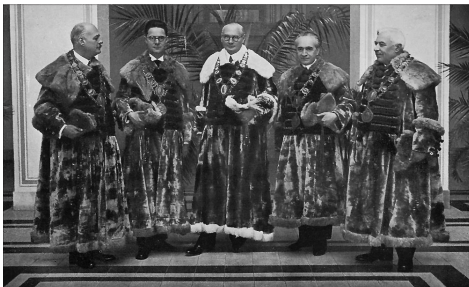
Az egyetem Tanácsa az 1939/40. tanévben