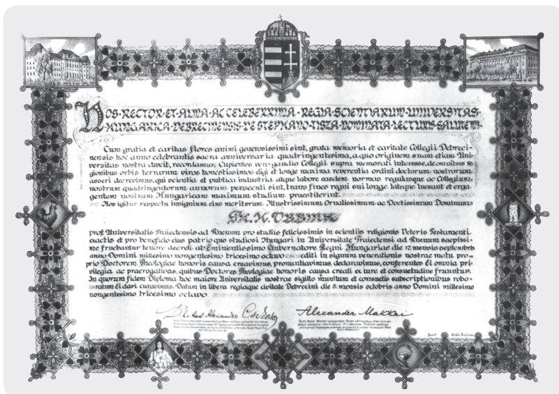
Herman Theodorus Obbink diszdoktori diplomája 128