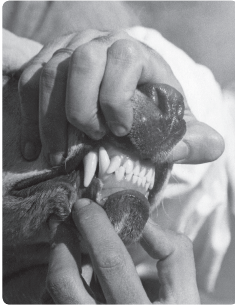
6. kép. Adler professzor kedvenc kutyájának, Móricnak koronát készítettett a klinika fogtechnikusaival

Debrecenben hunyt el 1983. augusztus 3-án. Abban az évben még két másik – nemzetközileg is elismert – debreceni orvosprofesszor halt meg, Kettesy Aladár és Krompecher István. Mindhármukról volt egy közös megemlékezés 20 évvel később (2003-ban) a DAB-székházban és egy híradás a Fogorvosi Szemlében a temetői megemlékezésről. 11