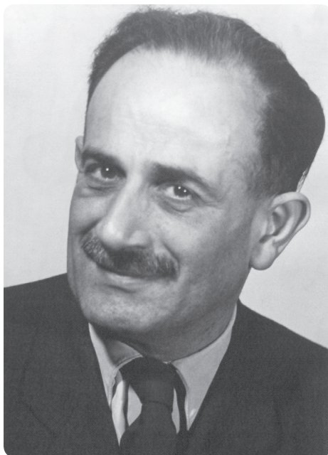
2. kép. Fotója az 1950-es évekből

A debreceni Stomatológiai Klinikán 1945 márciusában kezdte meg munkáját, ahol externista orvos, majd tanársegéd, adjunktus lett, 1946-ban mint egyetemi magántanárt habilitálták, és az év június 20-án megbízták a klinika vezetésével. 1948-tól klinikai főorvosként dolgozott, és 1952-ben addigi tudományos munkásságának elismerésével, megkapta az orvostudomány kandidátusa fokozatot. 1953-ban egyetemi tanárrá nevezték ki. Az orvostudomány doktora fokozatot 1957-ben nyerte el, „A fogváltás időrendjének egyes törvényszerűségei” című disszertációjának megvédésével.