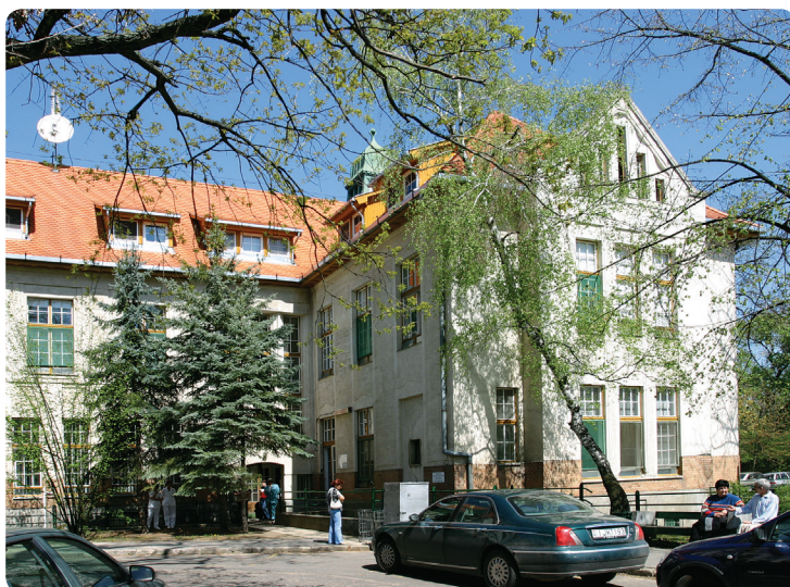
7. kép. A Szemészeti Klinika keleti szárnyában működött a Stomatologiai Klinika 1940–1981 között

A Stomatologiai Klinika a II. világháború befejezésekor egy két, ill. egy öt fogorvosi székes kezelőből, városzobává átalakított folyosóból, ebből közvetlenül nyíló műtőből, professzori rendelőből, két kórteremből és az alagsor három helyiségében elhelyezett, az akkori igényeknek megfelelően korszerűen felszerelt fogtechnikai laboratóriumból és egyéb, az üzemeltetéshez szükséges mellékhelyiségekből állt. Helyileg a Szemészeti Klinika keleti szárnyában működött 1940. novemberi átadása óta.