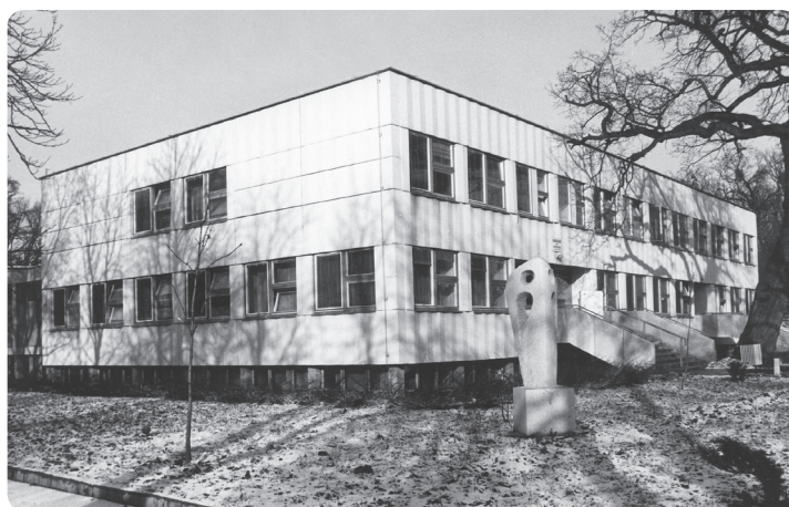
9. kép. Az 1981-ben átadott Stomatológiai Klinika

Jelentős létszám- és működésiterület-bővülés után 1966-ban kapta meg az intézet az első, akkor korszerűnek tartott Panoramix röntgengépet. 1973-ban megtörtént a stomato-onkológiai hálózat megszervezése. 16