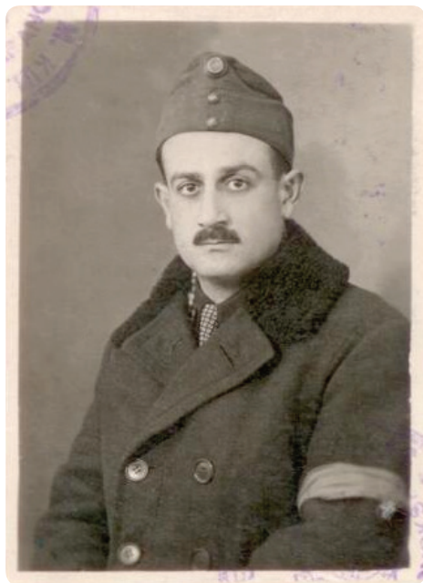
1. kép. Fényképe a zsoldkönyvéből (1940-es évek)