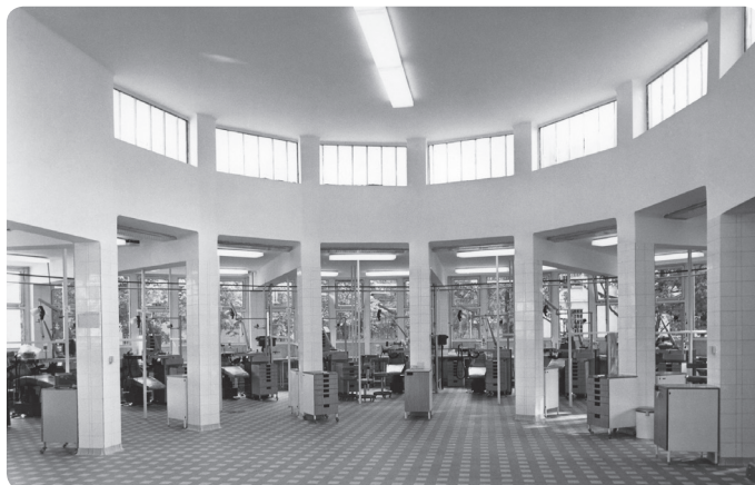
10. kép. A körkezelő egyik oldala

1976-ban Budapest, Pécs és Szeged után Debrecenben is megindult a fogorvosképzés (fogorvosi szak keretében). Kívánatosná vált egy új épület létesítése, s a tervek lassan körvonalazódtak. Az alapkövetelményre 1976-ban került sor, de a tényleges építkezéshez csak 1979-ben láttak hozzá. 17 Az új klinika kialakításánál Adler professzor figyelembe vette az Egyesült Államok egyik fogorvosi karán látottakat, és körkezelő létrehozása mellett döntött. A terve messzemenően bevált a klinikai gyakorlatok során, mivel az oktatók könnyen és megfelelően figyelhetik a hallgatói betegellátás menetét.