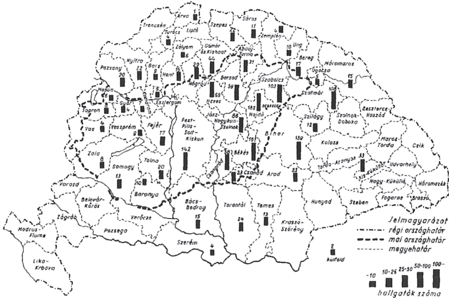
1. ábra. A debreceni mezőgazdasági akadémia hallgatóinak származási helye az 1868–1908 közötti években

hallgatók már a főiskolai tanterv alapján kezdjék meg tanulmányaikat. Pallag sajnálkozását fejezte ki amiatt, hogy az Alföld agrárképzési központja kiszorult a minőségi átszervezésből. Pedig a főiskolai képzés elindítása tovább növelte volna Debrecen vonzerejét – ami addig megvolt – nemcsak az Alföldön, hanem az ország más területein is. A megalapozott bizakodásra utal a beiskolázott hallgatók származási hely szerinti megoszlása 1868–1908 között, illetve az 1930-as évek elején. (1., 2. ábra)