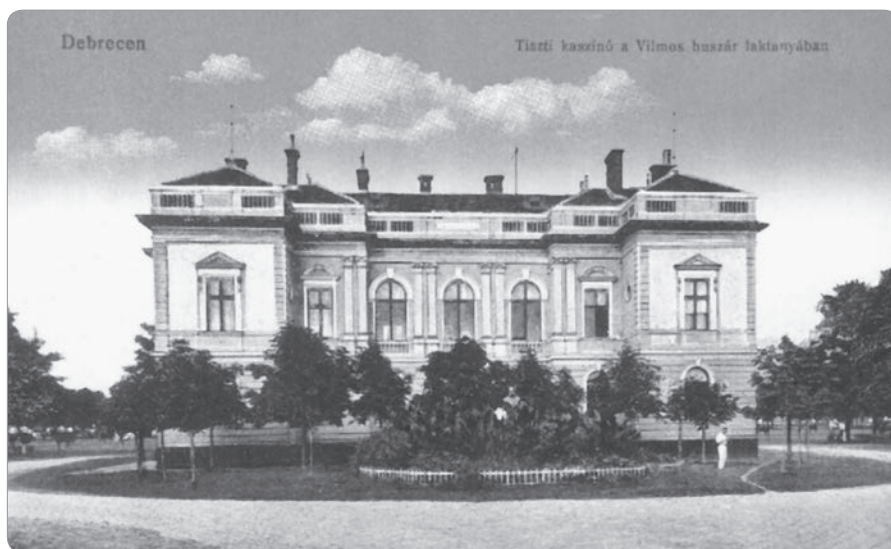
6. kép. Korabeli képeslap: Tiszti kaszinó a Vilmos huszárlaktanyában. A mai Kancellária épülete. 38