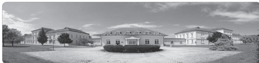
9. kép. A Debreceni Egyetem Állam- és Jogtudományi Karának jelenlegi épülete a Kassai úti Campuson. 59

A felújítás után végül a jogi kar átköltöztetése két ütemben történt meg. Elsőként a kari „főépületből” (mai Kancellária II. sz. épület) költözött át az A és B egységekbe. A második ütemben, 2015. február végén, a C épületrészben elkészült irodákat foglalhatták el azok a jogi kari tanszékek, amelyek korábban az inkubátorházban működtek. 58 Végül az ünnepélyes átadásra 2015. május 22-én került sor. A jogi kar korábban a campus területén található két másik épületben működött, ezekbe a Kancellária egységei kerültek utóbb.