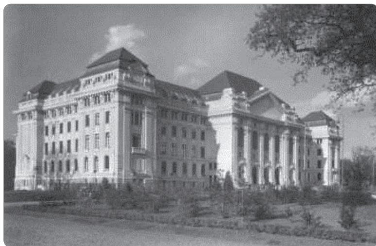
4. kép A Debreceni Magyar Királyi Tudományegyetem központi épülete nem sokkal az átadás után. 32

kormányzati körökben alig két hónap alatt eldöntött a debreceni jogi kar »szüneteltetése«, tulajdonképpeni megszüntetése”. 31 Mindez azt eredményezte, hogy Debrecen egyetemi épületei évtizedekig nem láttak joghallgatót falaik között.