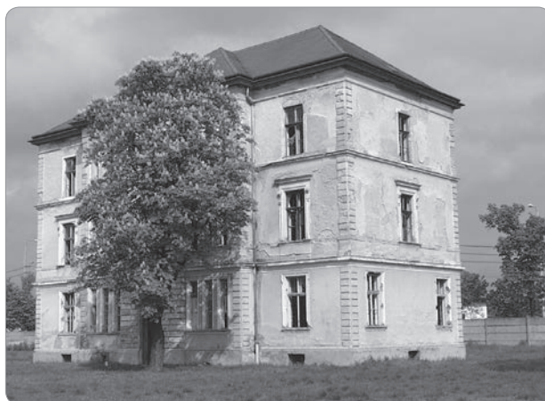
8. kép. A laktanya 3. számú épülete, a DE ÁJK későbbi székhelye a felújítás előtt. 52

A következő évek fejlesztései a jogszoktatás infrastrukturális alapjait tovább erősítették. Erre szükség volt, hiszen a tanszéki épület átadása az intézet oktatási tevékenysége terén a helyhiányt nem számolta még fel. Ezekben a tanévekben a hallgatók nemcsak a laktanya már kész épületeiben (Közgazdaságtudományi Kar épületei, Lovarda), hanem város más részein elhelyezkedő egyetemi épületekben is hallgattak jogi órákat. Egy-egy oktatási napon ezek az évfolyamok az egyetem Főépületének Aulájában, a Kölcsey Ferenc Református Tanítóképző Főiskola, valamint a Műszaki Főiskola épületében is megfordultak. 2002-ben a Társadalomtudományi és Egészségtudományi Oktatási és Központ és Könyvtár 53 (TEOK) megépítésével sikerült ezeket a nehézségeket is felszámolni. Az épület több ütemben valósult meg. Elsőként a szemináriumi termeket és nagyelődókat is magában foglaló oktatási szárny, majd a Társadalomtudományi Könyvtár épült fel, mely utóbbiban a jogi és közgazdaságtudományi szakirodalom kapott helyet. 54