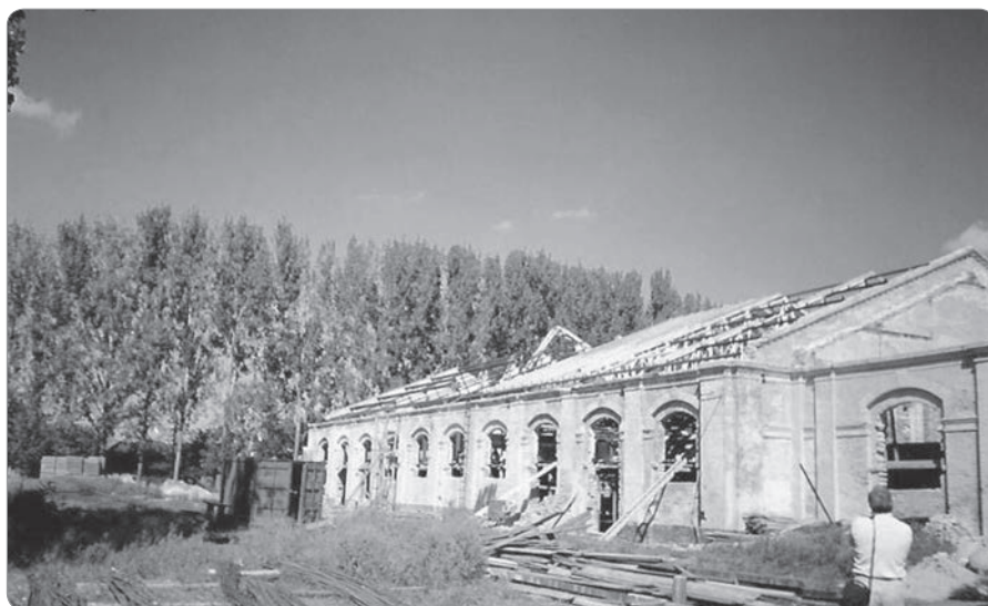
7. kép. A Lovarda a felújítás alatt. 41

Szabadság útja sarkán elhelyezkedő épületben, a III. kerületi tanács épületében postahivatal és sütőipari helyiségek kialakítására adtak engedélyt. 42 A laktanyának ezt a sarokrészét kerítés választotta el a többitől. 43 A szovjetek az itt tartózkodásuk alatt bővítették a területet, illetve részben a második világháború során elpusztult épületek helyén, részben az egykori istállók és alakulótér területén új épületeket emeltek, összesen 19 darabot. „Az átadás-átvétel során a terület a magyar állam tulajdonába került, az 1990-es évek második felében ugyanakkor a kezelői jogot a Debreceni Universitas Egyesület kapta meg, amely a debreceni felsőoktatás területi kiterjedésének legfontosabb zálogaként kezelte az ingatlant.” 44