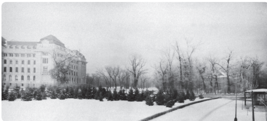
A templomépítésre kijelölt telek a központi épület szomszédságában

Amikor harmadik alkalommal ült össze a Templomépítő Bizottság, ismét napirendre került a templom elhelyezésének kérdése, melynek tekintetében elsődleges szempont az volt, hogy az ülésen megjelent kultusz-államtitkár, dr. Tasnádi Nagy András a vallás- és közoktatásügyi miniszter nevében jóváhagyja azt. Ez azonban nem valósult meg, hiszen Hóman Bálint kultuszminiszter döntését tolmácsolva az államtitkár bejelentette, hogy a templom semmiképp sem építhető hozzá az egyetem központi épületéhez. A döntést két egyszerű érveléssel támasztotta alá a felsőbb vezetés: a tervezett megoldás megbontaná egyrészt az egyetem központi épületének, másrészt pedig az építendő templom építészeti egységét. Bejelentésében a leendő lelkész személyéről is tájékoztatott, aki Hóman Bálint javaslata alapján csak egyetemi, teológiai tanár lehet. Az elhelyezés kérdését most már az elhangzottak fényében a bizottságnak ismét fontolóra kellett vennie, ezért az ülés keretében azonnali helyszíni szemlét tartva abban állapodtak meg, hogy: „[...] az egyetemi templom helye a központi épület bal oldalán elterülő bokor kerítéssel körülhatárolt tisztás legyen. [...] az egyetem épületétől legalább 40 méter távolságban”. 26