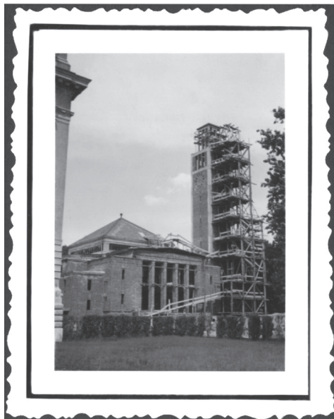
A templom építésének állapota az alapkövetétel napján (forrás: http://hdl.handle.net/2437/84729 ; letöltve: 2016. 10. 01.)

hogy a Templomépítő Bizottság elhatározására az ifjúság tettelegességgel válaszolt, és az egyetem minden fakultásáról eltanácsolták a zsidó diákokat, akik eleget is tettek a jobboldali keresztény diákság kérésének. Mi több, az egyetemi ifjúság azt is elhatározta, hogy maguk akadályozzák meg az építési munkálatokat, ha az szükséges. 41 A történetről beszámolt az Uj kor – A „Nyilastábor” lapja, valamint a Magyarság is, amelyek a korszakban a magyar nacionalizmus kifejeződésének fontos orgánumai voltak. 42