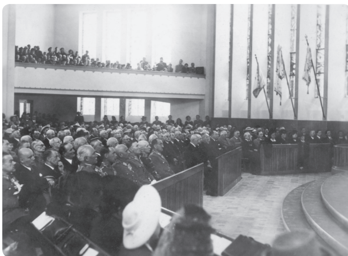
Az Egyetemi Templom felszentelési ünnepsége 1942. május 17-én