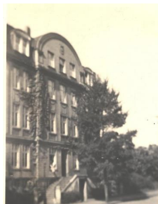
Kühlerék háza, ahol Forró a nyarat töltötte