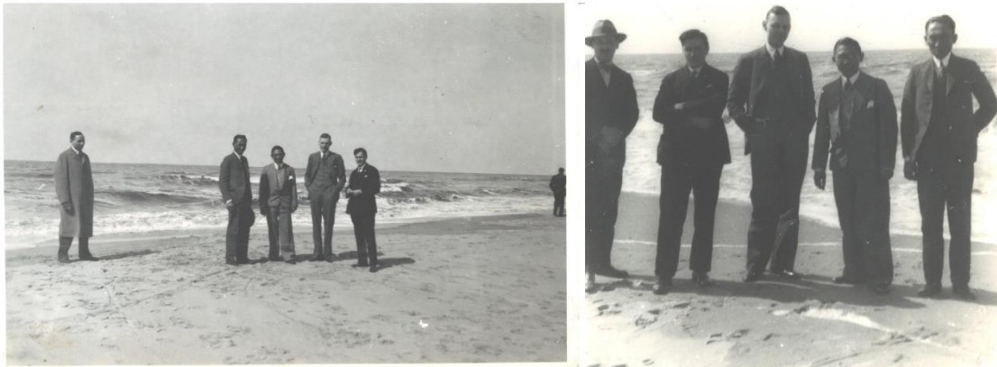
Nemzetközi Diákklub tagjai Noordwijkben a tengerparton 1933. április 23.