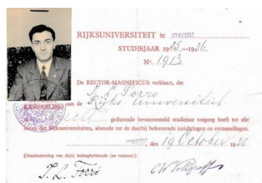
Forró Imre beiratkozását igazoló dokumentumok