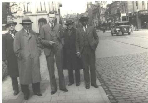
Nemzetközi Diákklub tagjai Utrechtben