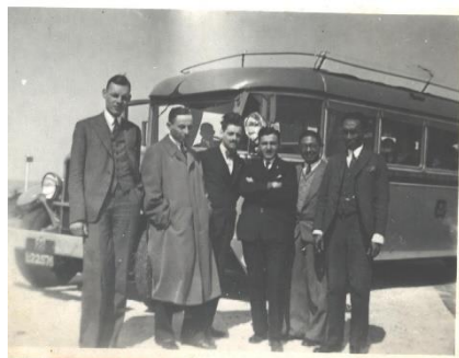
Nemzetközi Diákklub tagjai autóbusszal úton a virágmezők felé. 1933. április 23.