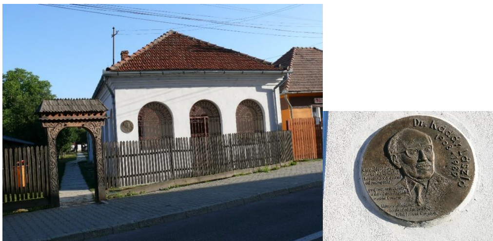
1. kép Kádár-ház és az emléktábla Kovásznán

Tanulmányait még a Délvidéken kezdte, gimnáziumba előbb Karánsebesen járt, de az első világháború után Kisújszálláson, majd Budapesten folytatta. Az újpesti Könyves Kálmán Gimnáziumban érettségizett 1926-ban.