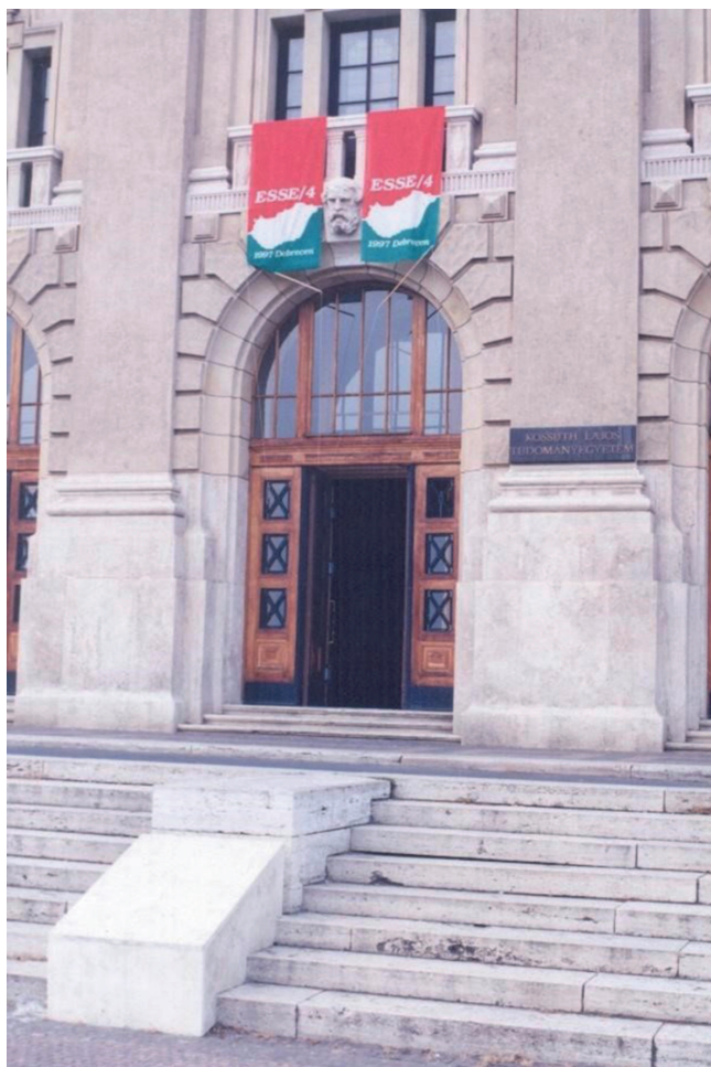
ESSE 4. konferencia a Debreceni Egyetemen 1997-ben

ben az 1989-ben szerény keretek között megrendezett első nemzetközi anglisztikai konferencia után 1997-ben mi szerveztük meg az ESSE negyedik európai konferenciáját több mint 600 résztvevővel! Ez pedig a debreceni anglisztika egyik leglátványosabb elismerése volt. És ebben nemcsak a szakmai színvonal magas minősége játszott szerepet, hanem az, hogy az intézetben szinte folyamatosan voltak olyan kollégák, akik az oktató-kutató munka mellett örömmel vettek részt különféle hazai és nemzetközi események megrendezésében. Kialakult egy olyan menedzsment-szemlélet, amely egészen új oldalról világította meg a debreceni anglisztikai műhely hazai és nemzetközi jelentőségét. Nem véletlen, hogy az évtized végén a mi intézetünket kérték fel arra, hogy a nagyváradi Partiumi Keresztény Egyetemen segítsünk kiépíteni egy angol tanszéket.