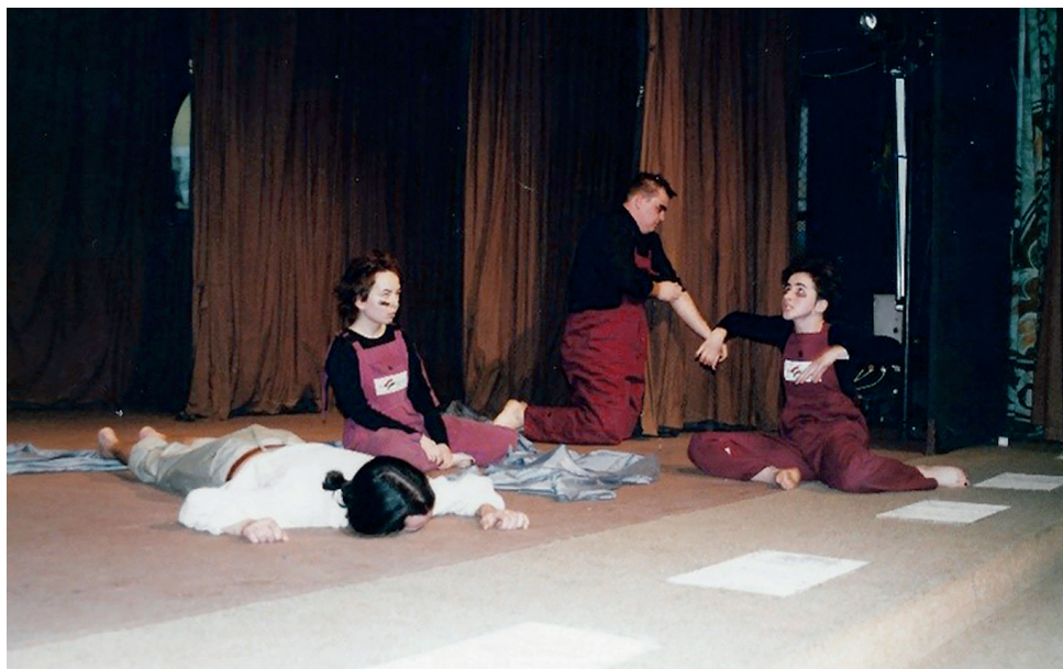
Histoire de la fée Tünde et du prince Tchongor (Csongor és Tünde), 2001

prince Tchongor (Csongor és Tünde) című drámai költeménye. A másik darab ugyancsak fordítás, August Strindberg La plus forte (Az erősebb, eredeti címe: Den starkare) című darabja. Az III. Nemzetközi Egyetemi Színházi Találkozóra február 14. és 17. között került sor, a helyszín az előző évtől eltérően nem a Lovarda, hanem a Kőlcsey Művelődési Központ bábszínháza volt. A társulatok Liège-ből, Compiègne-ből, Pozsonyból, Isztambulból, Budapestről érkeztek, a Bouffons a Vörösmarty-darabot adta elő. A harmadik alkalom után talán nem túlzás azt állítani, hogy a találkozó hagyománnyá vált, amit mi sem bizonyít jobban, mint hogy egyre nagyobb terjedelmű beszámolók jelentek meg a sajtóban, és nemcsak helyi szinten (a Hajdú-Bihari Naplóban és az Egyetemi Életben ), 33 hanem a Zsöllye című országos hetilapban is, Zala Zoltán Szilárd tollából. A találkozót, csakúgy, mint az azt megelőző kettőt, megtisztelte jelenlétével az AITU ( Association Internationale du Théâtre à l'Université ), az Egyetemeken Működő Színházak Világszövetségének elnöke, Robert Germey, aki a belgiumi Liège-ből érkezett Debrecenbe. 34 A korábbiaktól eltérően – bár a bemutatott darabok jó része ezúttal is francia nyelvű volt – egyéb nyelven előadott produkciókat is megtekinthetett a közönség. A pozsonyi csoport szlovákul, az isztambuli törökül játszott.