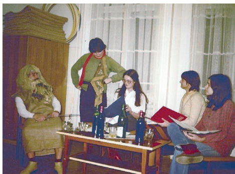
A Bouffons előtti időszakból: Intézeti est, 1983