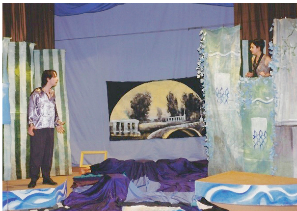
La nuit vénitienne, 1998

„Létezik egy számítási módszer, mely szerint az előadás egyetlen percéért három óra próbával kell megfizetni. Nem kell persze görcsösen ragaszkodni ehhez, ám csak akkor lehet nyílt tekintettel kiállni a színpadra, ha a produkció mögött ennyi energia van. Minden egyes gesztus, mondat mögött meggyőződésnek kell lenni, s addig dolgozunk, amíg a darabot mindenki szeretni nem tudja.” 24