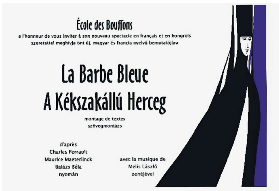
A La Barbe Bleue című előadást hirdető szórólap, 2002 38

apadt el a hallgatói utánpótlás, a jelen és főleg a jövő időből szinte egyetlen pillanat alatt lett múlt: Il était une fois les Bouffons , Volt egyszer egy Bouffons.