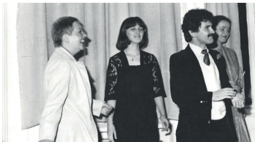
Az első Bouffons-darab: La Nuit vénitienne, 1985

zatokat. Elfogadja őket, ha igazán hozzá szólnak, értetlenül áll előttük, ha nem a megfelelő formában fogalmazódnak meg, vagy visszautasítja őket, ha meggyőződéssel ellenkeznek és művészi színvonaluk silány. Aki a színházi munkában szeretné önmagát kiteljesíteni és a közösséget szolgálni, legyen tudatában az ezzel járó hatalmas felelősségnek! Tudja azt, hogy az estéről estére egybegyűlő közönség várakozással van tele az őt érintő lényegi problémák megoldását illetően! Ami nem azt jelenti, hogy tézisek megvitatására vásárolt bérletet, váltott jegyet. Legtöbbször már az is pillanatnyi megoldást jelenthet, ha kívül helyezhetjük magunkat hétköznapijaink körülményein, s a képzeletbeli emberekkel képzeletbeli világban járunk, ha saját hiányosságainkat színpadi figurák ügyetlenkedéseiben találhatjuk komikusnak, ha szorongásainkat drámai szituációkban vergődő szereplők szenvedik helyettünk.” 3