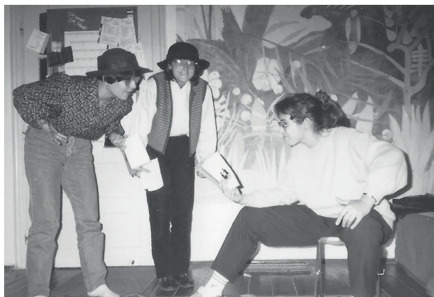
En attendant, próba, 1992

felhangjai voltak ezeknek az előadásoknak, akkor csak azért, mert a világ ilyen, vagy én látom ilyenek a világot. Az abszurdítás mint tény bemutatása mellett fő törekvésünk, hogy a csodába vetett erős hitet is közvetítsük. Talán ettől fordul játékba minden komolyan mondott tragédia a kezem alatt.” 10