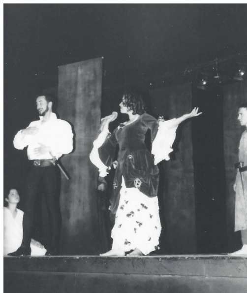
Peinture sur bois (Fafestmény), 1996