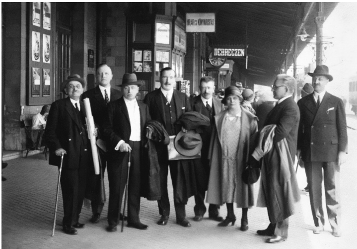
1. kép. A Tisza István Tudományos Társaság

A kevésbé jelentős társulások közül a Szépmíves Céh nem épített szigorú válaszfalat dilettantizmus és hivatásos művészlét közé, s az irodalom- és művészetpártolás feladatát a legszélesebb, legpopulárisabb értelemben fogva föl, minden írói és művészi próbálkozást meleg jóindulattal fogadott. 7