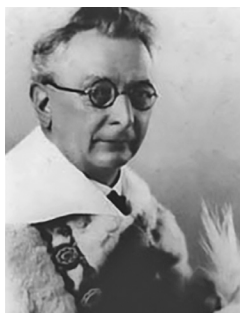
2. kép. Tankó Béla