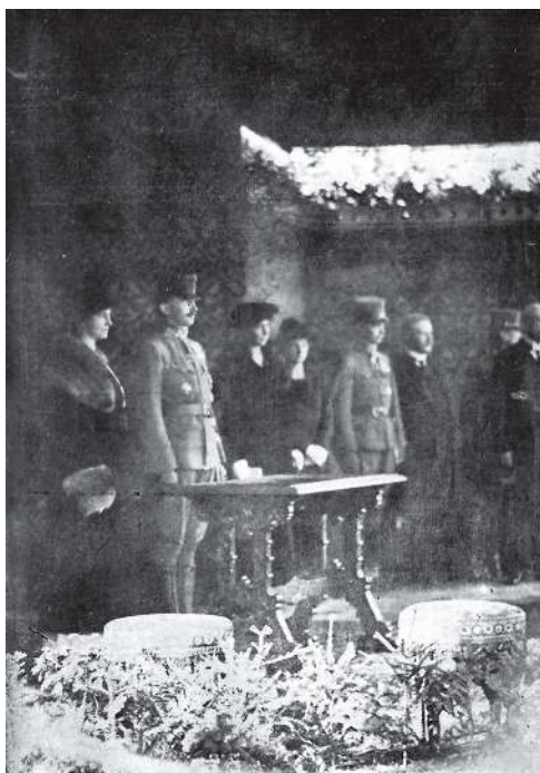
IV. Károly és Zita királyné a felvételi épület avatási ünnepségén (1918. október 23.)