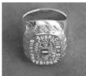
Osztrák sub auspiciis Praesidentis gyűrű

1926 után egészen 1944-ig ismét visszatértek az aranygyűrű adományozásához. Az aranygyűrű súlya meghatározott volt, a formája szerint pedig pecsétgyűrű. A külső oldalán mindig a magyar címer, a belső oldalán az avatott neve és az avatás dátuma volt bevésve. A címer mintázata az aktuális állami címert követte és követi a mai napig is. A Magyarországon adományozott aranygyűrű nagyon hasonlít az Ausztriában a sub auspiciis Praesidentis avatásnál adományozott arany pecsétgyűrűhöz.