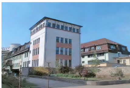
A „Torony-épület” utcafronti lát képe

Pályázati támogatással felépült a többemeletes, ún. „Torony-épület”, több, a legkorszerűbb eszközökkel felszerelt előadóteremmel és egy számítástechnikai szaktanteremmel. A kar szempontjából „új” épületbe költözhetett a dékáni hivatal, a tanulmányi osztály, valamint a gazdasági-adminisztrációs egység is, hiszen a megyei vezetés átadta a kar szomszédságában lévő, korábban görög katolikus püspöki palotának szánt épületet, amely az átadást megelőzően a Gyermek- és Ifjúságvédelmi Intézet központja volt. Napjainkra kialakult tehát az a vélhetően végleges épületegyüttes, amely korszerű és minden igényt kielégítő „mini-campus” formájában várja az oktatókat és hallgatókat. 30