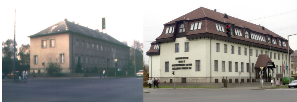
A kar Sóstói úti főépülete 1990-ben és felújítása után napjainkban

Az épületet a főiskola szerződésben foglaltak szerint „ideiglenes jelleggel” három évre kölcsönadta a városnak a demográfiai gondok enyhítésére való tekintettel, azzal, hogy azt „eredeti állapotában helyreállítva” fogja visszakapni – ami nem történt meg.