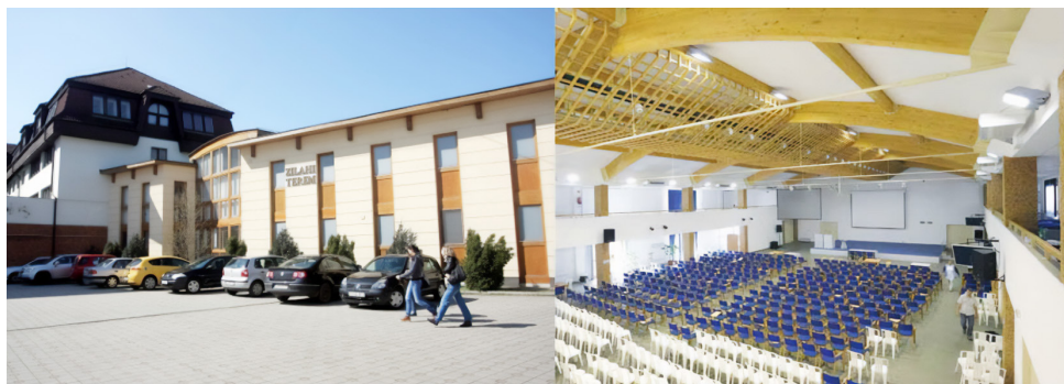
A Zilabi Terem külső és belső képe

Pályázati támogatással felépült a többemeletes, ún. „Torony-épület”, több, a legkorszerűbb eszközökkel felszerelt előadóteremmel és egy számítástechnikai szaktanteremmel. A kar szempontjából „új” épületbe költözhetett a dékáni hivatal, a tanulmányi osztály, valamint a gazdasági-adminisztrációs egység is, hiszen a megyei vezetés átadta a kar szomszédságában lévő, korábban görög katolikus püspöki palotának szánt épületet, amely az átadást megelőzően a Gyermek- és Ifjúságvédelmi Intézet központja volt. Napjainkra kialakult tehát az a vélhetően végleges épületegyüttes, amely korszerű és minden igényt kielégítő „mini-campus” formájában várja az oktatókat és hallgatókat. 30