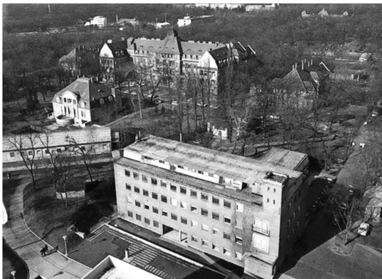
A Kórélettani Intézet. A háttérben Szülészeti és Nőgyógyászati Klinika, előtte a Kenézy-villa