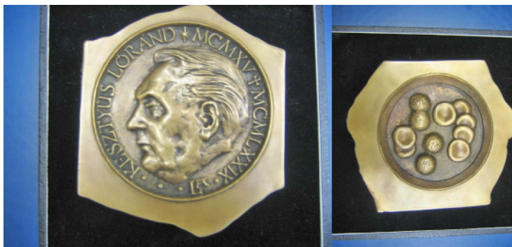
A Kesztyűs Lóránd emlékérem.

A MIT Kesztyűs Lóránd emlékéremet alapított, melyet kongresszusain ad ki a legnívósabb magyar immunológus kutatóknak. 20