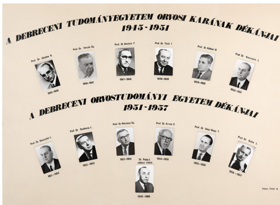
Orvostudományi deánok Debrecenben 1945 és 1957 között 15