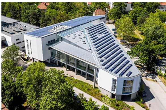
A Kóréletani és Mikrobiológiai Intézetek helyén épült, 2012-ben átadott In vitro Diagnosztikai Tömb

volt annak elnökeként vezetni. A DEOEC meg tudta őrizni a DOTE szakmai értékrendjét és szellemiségét. Létrehozta a Fogorvostudományi, Gyógyszerésztudományi és Népegészségügyi karokat új épületekkel. Az integrációs folyamatba megvalósult modern Élettudományi Épületbe kerültek a biokémia, a biofizika, a humángenetika, az immunológia intézetei. Jelentős klinikai fejlesztések történtek (többek között az „Augusztá” új kardiovaszkuláris központ megvalósítása, a Gyermekklinika bővítése, modern nukleáris medicina és képalkotó technológiák telepítése, a Kóréletani és a Mikrobiológiai Intézet helyén új diagnosztikai tömb építése a Laboratóriumi Medicina, a Mikrobiológia és a Genomika számára). Decentralizált működési modellel biztosította a korszerű klinikai ellátás stabil gazdasági hátterét. Jelentősen növelte a külföldi hallgatói létszámot, nemzetközi akkreditációt szerzett az orvoscépzésnek.