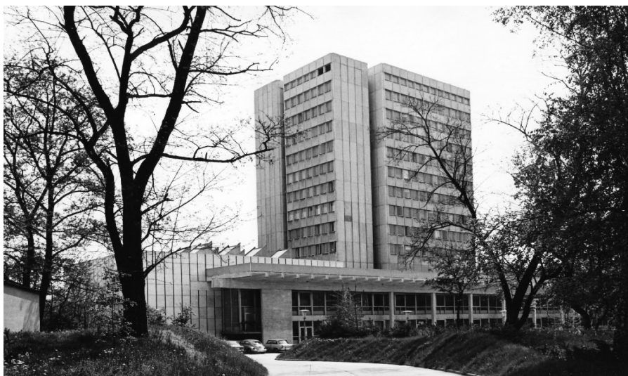
A DOTE Elméleti Tömb