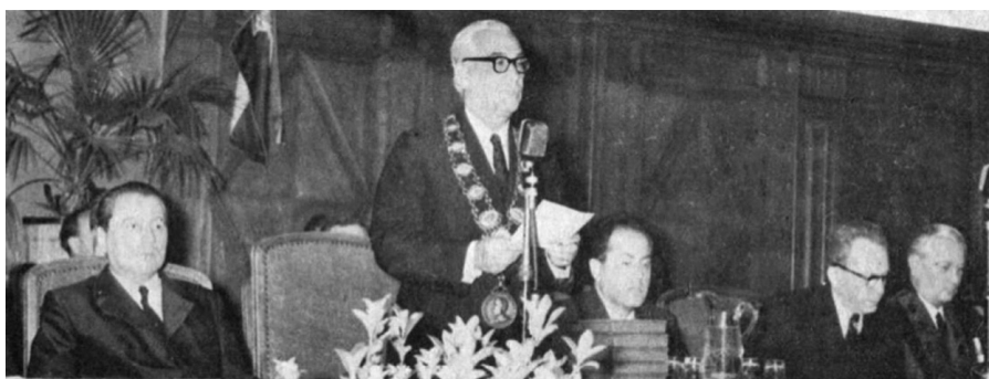
Tanévnyitó a Kossuth Lajos Tudományegyetemen, 1973. szeptember 15. 14