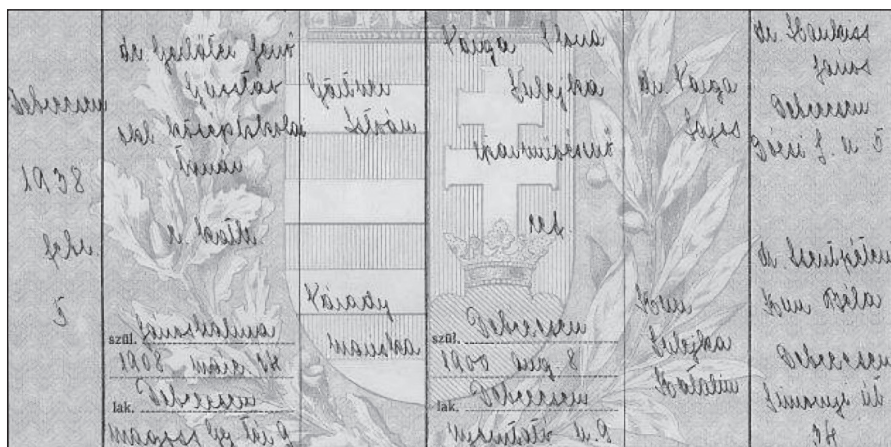
1. kép. Gerlőtei Jenő házassági bejegyzése 11

szakterületével kapcsolatos tanulmányok és recenziók. Sajnos, életéről nagyon keveset tudunk, jóformán semmilyen adat, fotó, relikvia nem maradt róla, a hazai adatbázisok és a debreceni egyetemi dokumentumok között még halálának időpontja sem ismert. 10