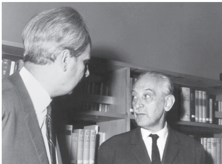
2. kép. 1967. Bölcsészolvasó avatása:

1967-ben két kutatói olvasóterem átadására is sor került: egy természettudományi és egy társadalomtudományi olvasó nyílt meg.