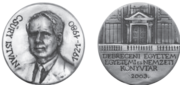
4. kép. A Csűry István Emlékelem

Ez a gazdag, a Debreceni Egyetemi Könyvtár falain messze túlmutató életpálya, a teljesítményekhez mérten, nem bővelkedett hivatalos elismerésekben. 2001-ben, születésének nyolcvanadik évfordulóján a frissen integrálódott Egyetemi és Nemzeti Könyvtár emlékülést rendezett, és megalapította a Csűry István emlékéremet. A korong alakú, 10 cm átmérőjű bronzérem egyik oldalán Csűry István domborított arcképe, CSŰRY ISTVÁN EMLÉKÉREM felirat, másik oldalán az Egyetemi és Nemzeti Könyvtár szimbolizáló kép (a Könyvtár díszudvar felőli főbejárata) látható.