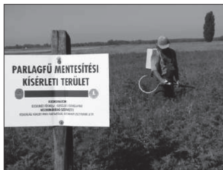
2. ábra. Bio-herbicid által elpusztított parlagfű a KNP Fülöpházai területen.