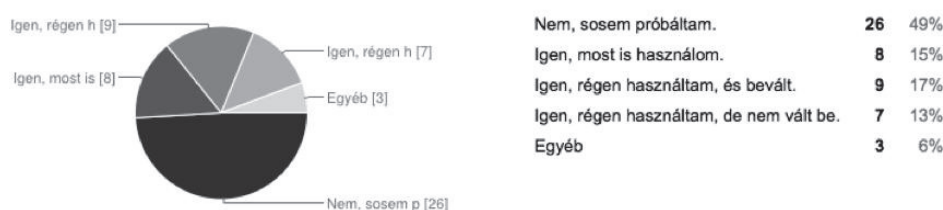
1. ábra: A kérdőív első kérdésére adott válaszok

31-en nem ismernek ilyen embert, 15-en ismernek, és úgy tudják, hogy bevált neki, heten válaszolták, hogy úgy tudják, az ismerősüknek nem vált be az e-nyelvtanulás. Ez ismét nagyjából 1/3-a (32%) az igenlő válaszoknak.