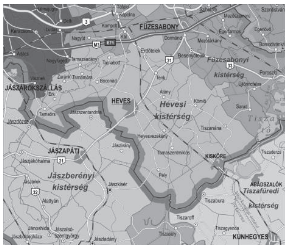
2. ábra A Hevesi Kistérség földrajzi elhelyezkedése és települései

Észak Magyarországi Régió, Heves Megye, Hevesi Kistérség települései közül ezen tanulmányban a következő települések kerültek vizsgálatom középpontjába: Átány – Erdőtelek – Erk – Kisköre – Kömlő – Tarnabod - Tarnaszadány - Tiszanána