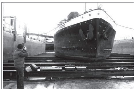
3. ábra: Sarokpontok meghatározása hajó külhéljén [3.]

A javításban történő felhasználás rendkívül szép példaként a centrifugális szivattyúk járókerekének rekonstrukcióját, valamint a turbinalapátok pótlását szeretném megemlíteni.