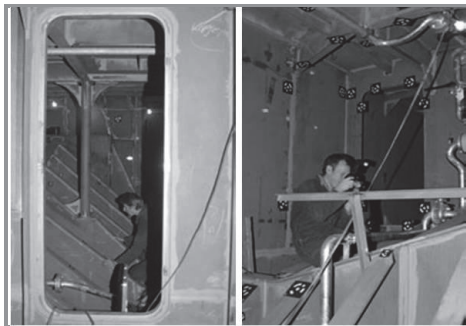
2. ábra: Sarokpontok meghatározása hajótestben [3.]

Az alábbi ábrákon éppen egy ilyen felmérés folyik.