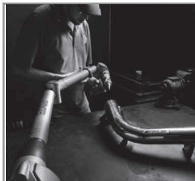
1. ábra: FARO letapogató csőgyártás közben [2.]

A térbeli szerkezetek digitalizálásának egyik fontos felhasználási területe a nagy kiterjedésű, bonyolult üregezésű objektumok – mint például a hajók. A hajók géptermeének beépítése nem egyszerű feladat, több előző cikkünk is foglalkozik a témával. Az egyik sarkalatos pont az objektum matematikai modelljének összehasonlítása a valós, felépült acélszerkezet geometriájával.