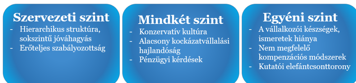
5. ábra: A vállalkozói egyetemmé válás előtt álló akadályok a szakirodalom alapján

A cikkek elemzése alapján az alábbi főbb állításokat fogalmazhatjuk meg a vállalkozói egyetemeken foglalkoztatott belső vállalkozók előtt álló akadályokkal kapcsolatban ( Hiba! A hivatkozási forrás nem található. ).