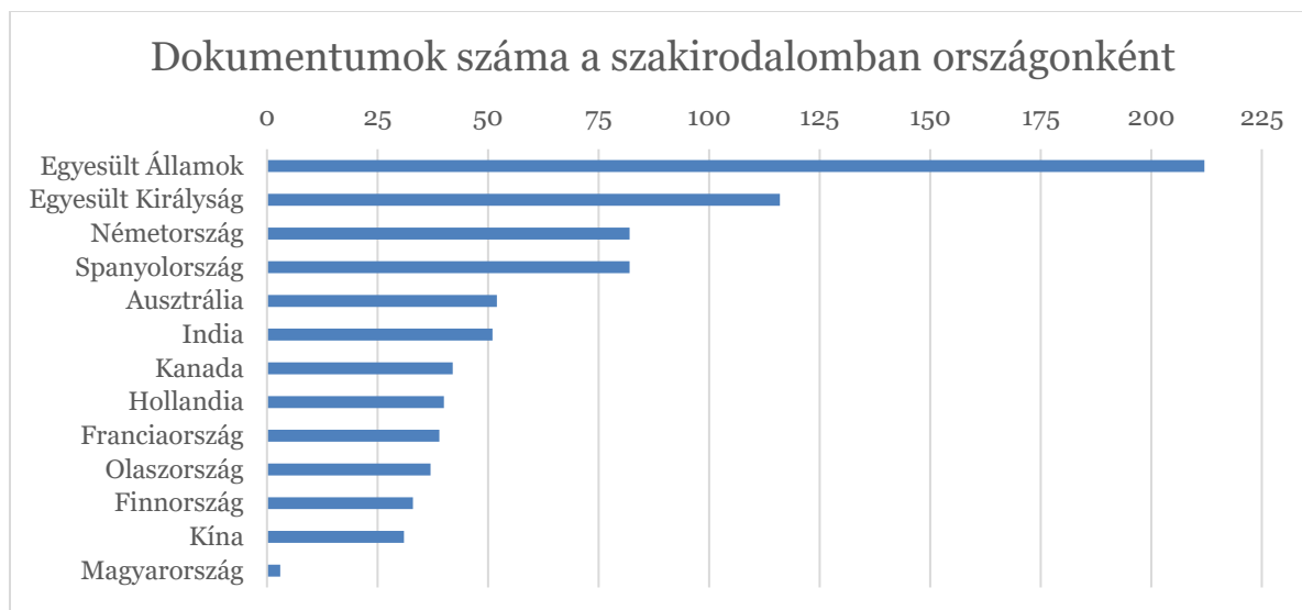
4. ábra: A Scopus adatbázisa alapján mely területekhez köthetőek az „intrapreneur**” keresőszóra megjelenő cikkek Forrás: Scopus