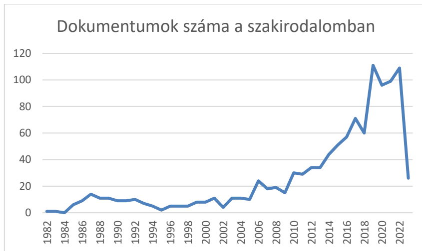
2. ábra: Az „intrapreneur*” megjelenése a szakirodalomban évente

Mind a Web of Science (WoS), mind a Scopus esetén lehetőség van az egyszerű keresőszavas keresésre, így elsőként az „intrapreneur*” kifejezésre kerestem rá, teret engedve ezzel példának okáért az intrapreneurship szót tartalmazó találatok megjelenítésének is. A Scopus 1096, a WoS 788 találatot mutatott, de talán még érdekesebb, hogy mindkét adatbázis esetében szépen látszik (2. ábra, 3. ábra), hogy a 80-as években kezdődött a fogalom használata, azonban csak több, mint 20 évet követően a 2000-s évek közepén kezdtek a kutatók behatóbban foglalkozni a belső vállalkozókkal, majd meredek emelkedés volt megfigyelhető, ami leginkább a vállalkozóiség kutatásával van összefüggésben.