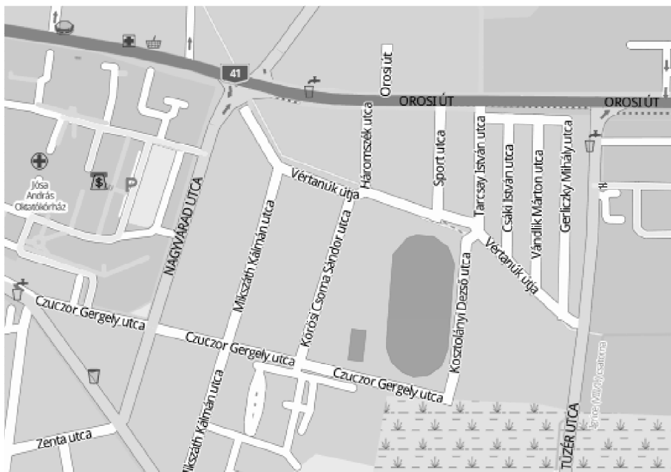
2. ábra – A Keleti lakótelep utcáinak elhelyezkedése (utcakereso.hu)