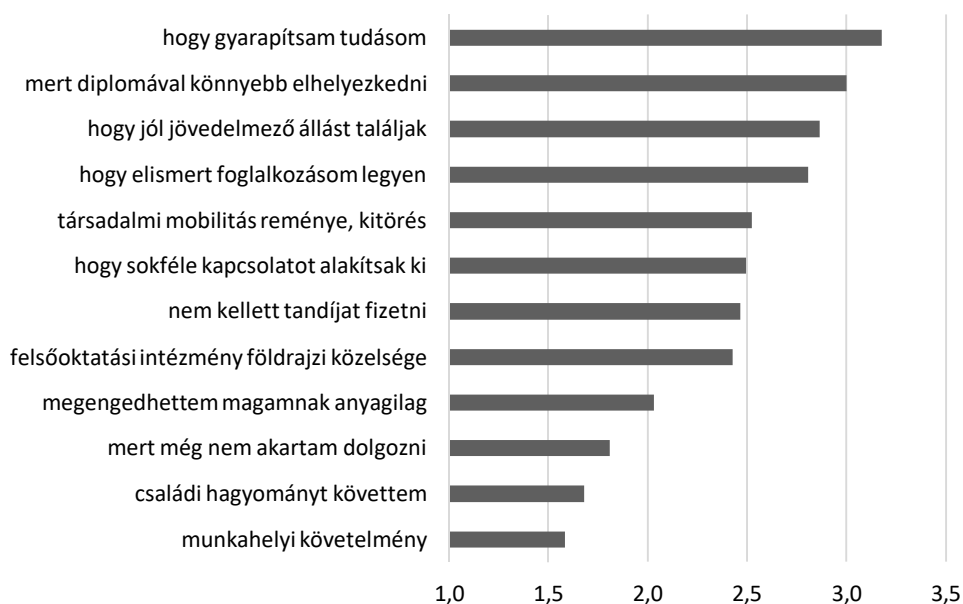
3. ábra A felsőoktatásba jelentkezés indokai (DEPART adatbázis, N=605, négyfokozatú skála átlagai)

Azt feltételeztük, hogy a lemorzsolódás jelensége a felsőoktatási motivációkkal is összefüggésbe hozható. A továbbtanulás legfőbb okait egy 12 ítemes kérdéssorral vizsgáltuk meg. A hallgatóknak az egyes kijelentéseket egy négyfokozatú skálán kellett értékelniük. Az átlagok alapján meg tudjuk határozni a legfontosabb motiváló tényezőket (3. ábra).